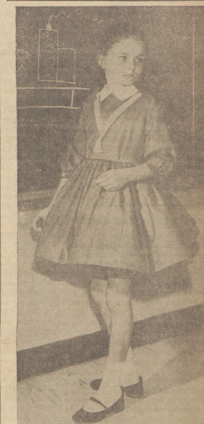
Sukienki z materiału "corduroy" na sezon jesienny są znowu bardzo popularne. Powyższy styl jest gustowny, parkietowy i łatwy do prania.

Marchew zawiera składniki chemiczne, które przyczyniają się do wzmocnienia wzroku.