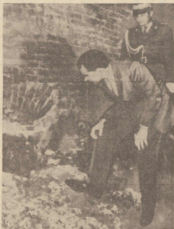
WICEPREZYDENT OGLADA WARSZAWSKIE GETTO. W czasie swego krótkiego pobytu w Polsce wiceprezydent Nixon udał się do pamiętnego getta w Warszawie, gdzie osiadał ciemnie, do której wtręcał Niemcy polskich Żydów w czasie okupacji Warszawy. Złożył on wieńiec z kwiatów w miejscu, gdzie budowany jest pomnik dla upamiętnienia udziału Żydów w walkach w czasie powstania warszawskiego.