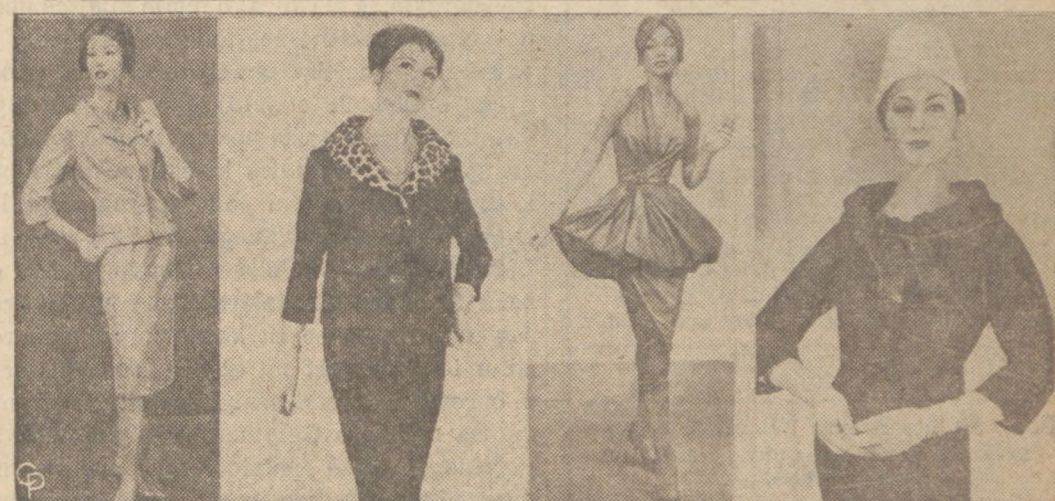
Najnowsze kreacje na sezon jesienny pokazane na wystawie New York Dress Institute. Górne (od lewej): kostium z brązowej wełny; płaszcz do stroju wieczorowego z brokady w deseni; suknia wieczorowa z żakietem; kostium z popielatej wlny. Dolne (od lewej): kostium na przyjęcia wieczorowe z jedwabnej brokady w złotym kolorze; kostium z czarnej wełny z kołnierzem futrzanym; suknia wieczorowa z fioletowego atlasu i kostium wełniany z kołnierzem futrzanym z perskich baranków.