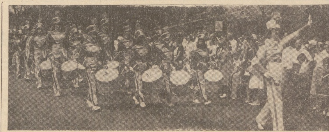
Drużyna Doboszy i Trębacz Gminy 80 ZNP weźmie udział w paradzie