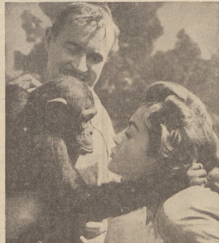
SMOOTHERS... Joanna Barnes, who portrays Jane in MGM's new jungle adventure, "Tarzan, the Ape Man," is all set for a kiss from Cheta the Chim, held by fellow actor Robert Douglas.

The government reports that 411,000 new businesses were established in the U.S. during 1958 and 356,000 were closed.