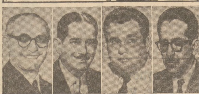
Arturo Frondizi, Argentina Ernesto de la Guardia, Panama Luis Somoza, Nicaragua Hernan Siles, Bolivia

KIPIACY WULKAN AMERYKI ŁACIŃSKIEJ. — W roku bieżącym w siedmiu krajach Ameryki Łacińskiej, do tej pory, wybuchły rewolucje i ruchy rewolucyjne. W dodatku, zjawiska swałow zanotowano w co najmniej sześciu innych krajach. Czerwona plama pozostawia ślady swych palców w wielu punktach. Jak pismo socjalistyczne "Prawda" stwierdza, w rejonie Am. Łacińskiej jest obecnie 360,000 komunistów.