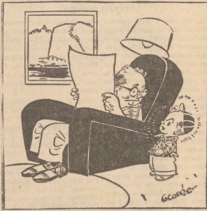
"I kissed a girl at the birthday party—they made me!"