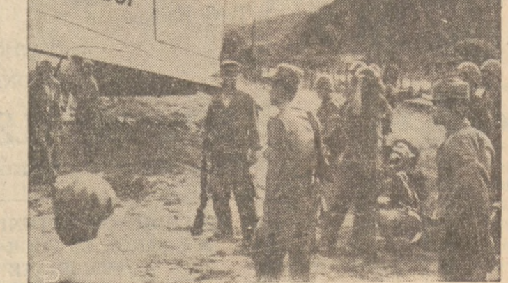
LAOS OCZEKUJE POMOCY ZJEDN. NARODÓW. W oczekiwaniu pomocy, o którą Laos, napadnięte przez Czerw. Chinę prosi Organizacja Zjedn. Narodów, wojska tego państwa, przetruczone samolotami nad północną granicę, przygotowują się do walk w prow. Sam Neua.

Policja zauważyła jadące szybko auto poprzez skrzyżowanie Damen ave, i Armitage ave. Poczęła auto to ścigać poprzez 3 ulice i zaułki. W pewnym momencie Schroeder i jego dwóch towarzyszy opuścili auto pozostawiając je przy 2138 Charleston ul. Zaraz w pobliżu aresztowano Schroedera, — a nieco później obu jego przyjaciół.