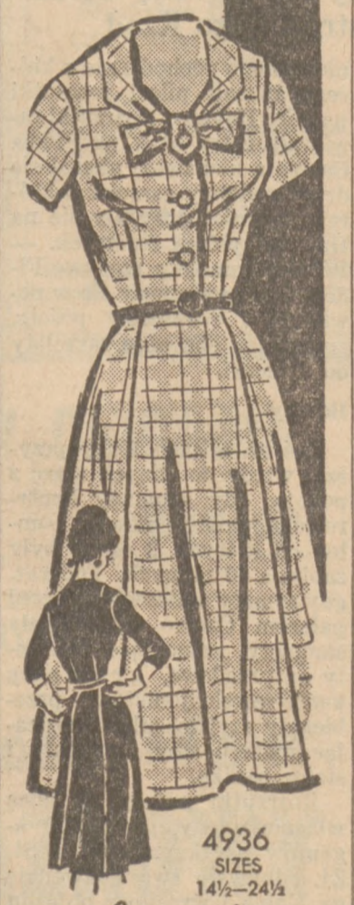
by Anne Adams Wzór 4936

Sukienka ta nadaje się szczególnie dla panów niższego wzrostu, a dzięki temu że spódniczka jest uszyta z kilinów, nadaje on smukłość tęższej figurze. Wzór 4936 można nabyć w wielkościach 14½, 16½, 18½, 20½, 22½, 24½. Na wielkość 16½ potrzeba 4 jardy 5 cal. materiału. Cena wzoru PRZEDZIĘSIĄT CENTÓW (50c). Należytość prosimy nadsyłać w srebrze lub 4c w znaczkach pocztowych (lecz nie sir mail) z Kanady zotówkę.