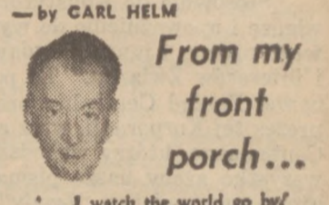
From my front porch... I watch the world go by!

Up until recently there was no data available in Poland which would have permitted an assessment of the standard of life of the workers and their families. No investigations of family budgets had been made and the minimum level of existence had not been ascertained, though, as the weekly "Zycie Gospodarcze" sarcastically remarked, "rising living standards were being proved by the consumption of paper per head of population and by decreases in the price of locomotives."