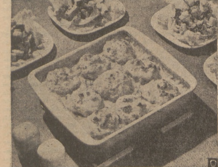
Your family will relish this hearty Lenten meal — Cheese Puff Tuna Casserole served with buttered green beans and apple raisin salad.

Golden Cheese Puffs, made from drop biscuit dough and pimiento cheese spread, top this satisfying Cheese Puff Tuna Casserole. This quick and easy main dish combines zesty celery-mushroom sauce, tuna and flaky cheese biscuits. Drop biscuits are an exciting and nourishing addition to many casseroles. Baked with enriched flour, they supply food iron and three essential B-vitamins needed daily for growth and good health.