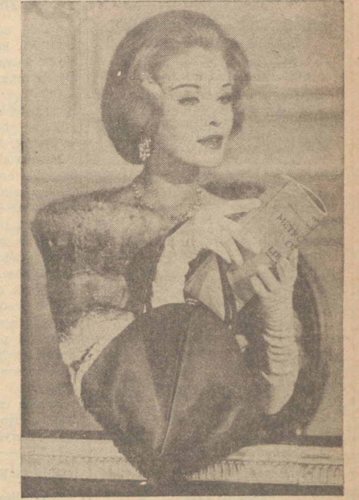
Ładna torebka do stroju wieczorowego, zrobiona z czarnego aksamitu a przybrana frenzlą u spodu.