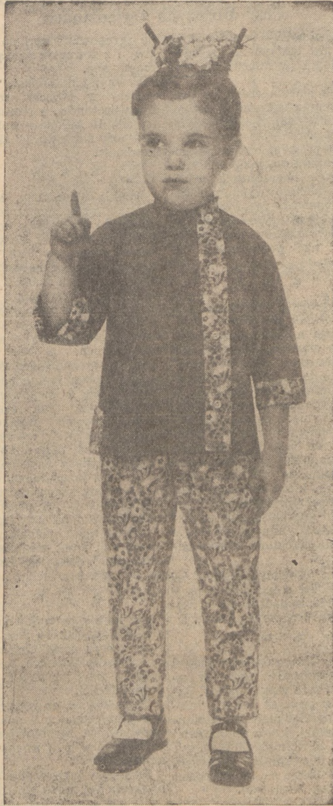
Wygodne o chińskim stylu pyżamy dla małej dziewczynki.