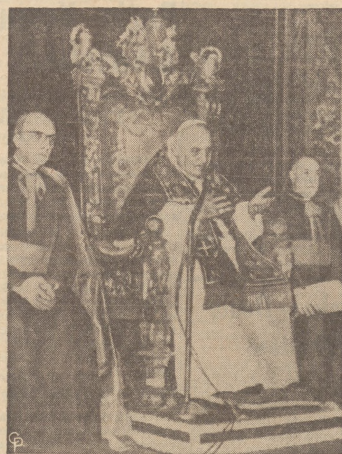
ŚWIATECZNA MOWA PAPIEŻA. — Papież Jan XXIII, siedząc na swym tronie w Hallu Konsystorsalnym w Watykanie wygłosił doroczne świąteczne przemówienie do wiernych całego świata. W przemówieniu tym zaznaczył że "nowoczesny człowiek przekroczył i nadużył święty świat pokoju prawie nie do rozpoznania".

Zostań abonentem "Dz. Związkowego" jeśli nim dotychczas nie jesteś.