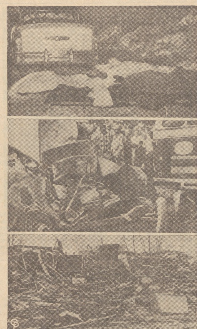
ŚMIERĆ KOSI... — Śmierć zbiera swe obfite żniwo na jedniach w kraju. Oto właśnie wypadki. Na zdjęciu górny — scena po fatalnym uderzeniu auta w budynek w pobliżu Haverstraw, N.Y. Jedenasto osób zostało zabitych, troje dzieci ocalało. Pośrodku — w zderzeniu się auta z autobusem w Weslaco, Teksas, trzy osoby poniosły śmierć w aucie, dwie osoby, pasażerowie autobusu zostały ranne. U dołu — po eksplozji fabryki w Warsaw, Ky. 11 osób skierowano do szpitala, 15 domów uległo zniszczeniu, około 30 domów zostało uszkodzonych. Fabryczka została zrównana z ziemią.