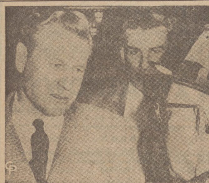
ROCKEFELLER WYCOFUJE SIE Z KANDYDATURY. — Gubernator Stanu New York, Nelson Rockefeller (z lewej) w kilku słowach oświadczył repertorium w Filadelfii, że nie będzie kandydował na Prezydenta w wyborach w roku 1960. Swoje wycofanie się wyjaśnił, że "olbrzymia większość tych co kontrolować będą konwencje republikańskie nie zgadza się na jakikolwiek kontest na nominację". Oświadczenie to było zaskoczeniem dla Wiceprez. Nixona, który uważa, że Rockefeller jest człowiekiem przeznaczonym do kontynuowania przewodnictwa w partii republikańskiej i kraju — w przyszłości.

Ludzie ci, po tygodniach wędrówki po wawozach i stokach górskich zasypanych śniegiem, przybyli do Boudha jedynie z tłumaczkami na plecach. Niektórzy, przezwinięci, byli podczas swej ucieczki z kraju pochwyleni i obrabowani z rzeczy bardziej wartościowych przez komunistów chińskich. Obecnie grozi im po prostu śmierć z głodu i chłodu, jeśli nie będzie szybkiej akcji ratunkowej.