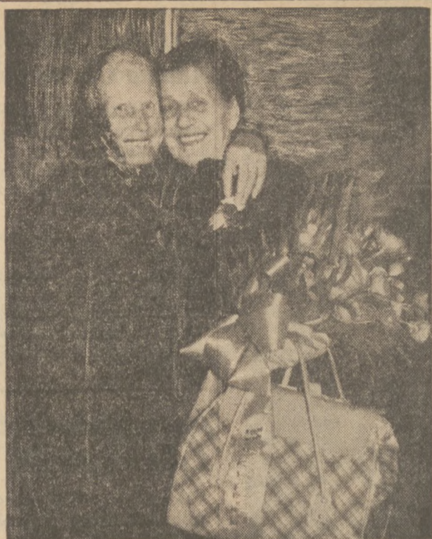
Gość z Polski

Samouczek "JAK WRÓZYĆ Z KART" zawiera 96 stronice czytelnego druku, wraz z rycinami poszczególnych kart i tabelkami ich rozkładu do wróżenia. Książka ta kosztuje tylko $1.00 + przesyłka Zamówienia wraz z należnością nadsyłać należy DZIENNIK ZWIĄZKOWY 1201 MILWAUKEE AVE. Chicago 22, Illinois (C.O.D. nie wysyłamy)