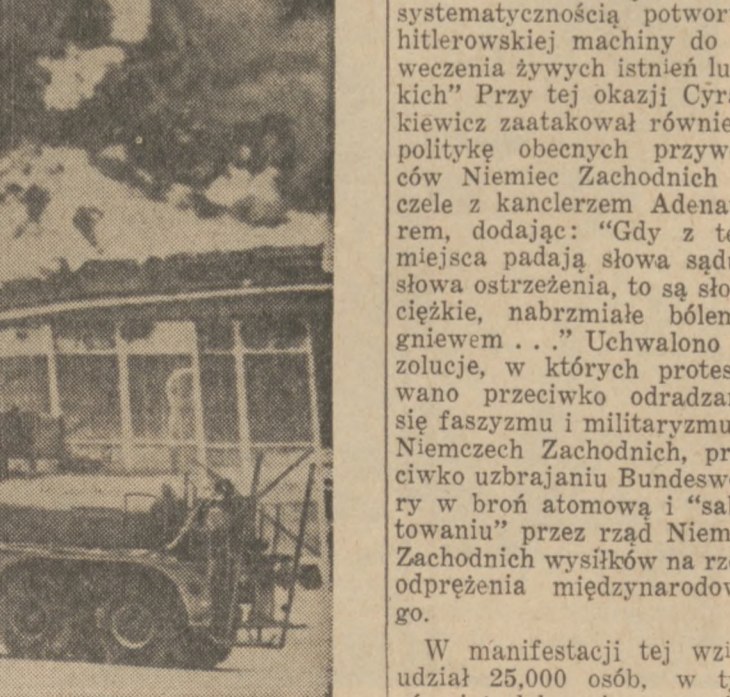
KATASTROFA STRATO-CYSTERNY. — Na lotnisku Bazy Lotniczej w Nowo Meksyku startujący samolot strato-cysterna KC-135 uderzył w potężny hangar i zapalił go, po eksplozji, która nastąpiła natychmiast po uderzeniu w budynek. Szczęść osób z załogi poniosło śmierć.

W manifestacji tej wzięło udział 25,000 osób, w tym również delegacje zagraniczne ze Związku Sowieckiego, z Francji, Anglii, Włoch, Austrii, Szwecji, Węgier i Czechosłowacji.