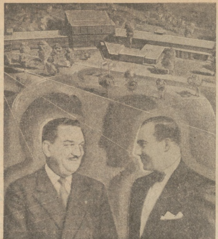
Zdjęcie powyższe przedstawia kongresmana Zablockiego i architekta Biernackiego - Poraya na tle projektu szpitala dla dzieci w Krakowie, który głównie dzięki ich wysiłkom zostanie zbudowany jako dar Ameryki dla Polski.

Pensja komisarza policji chicagowskiej wynosi 22,500 dolarów rocznie.