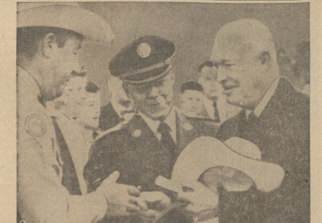
KAPELUSZ "KOWBOJSKI"—DLA PREZYDENTA. — Prezydent Eisenhower, wracając z Kalifornii na Wschód, do Waszyngtonu otrzymał od szefa policji jednej z małych miejscowości pustynnych okolic tego Stanu, kapeluszy kowbojski—na pamiątkę. Oto moment wręczenia. Jak podają wiadomości—Prezydent jest zainteresowany Palm Spring i nawet zamierza tam kupić dom dla siebie.

Restauracja otwarta będzie stale w dni powszednie za wyjątkiem poniedziałku od 9ej po poł. do 1ej, a w niedzielę od 12ej do 9ej wiecz. DOJAZD DROGĄ Nr. 12 LUB INDIANA TOLL RD.