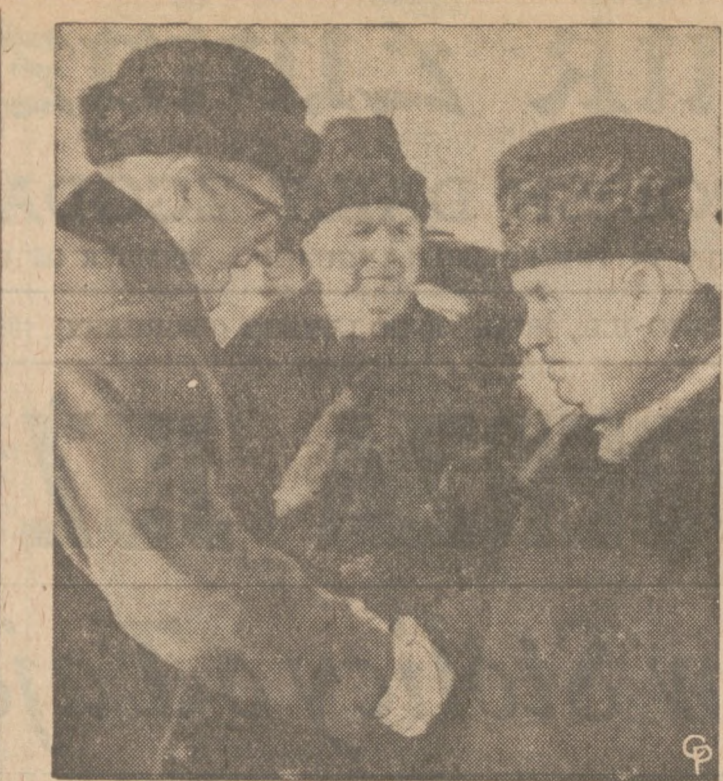
PREZYDENT WŁOCH W MOSKWIE. Prezydent Włoch, Giovanni Gronchi (z lewej) pojechał do Moskwy z wizytą. Powitał go m. in. lotniskiem premier sow. Chruszczow (z prawej). Wizyta Gronchi'ego do Rosji wywołała żywe odzewy kontrowersyjne w kołach politycznych we Włoszech.