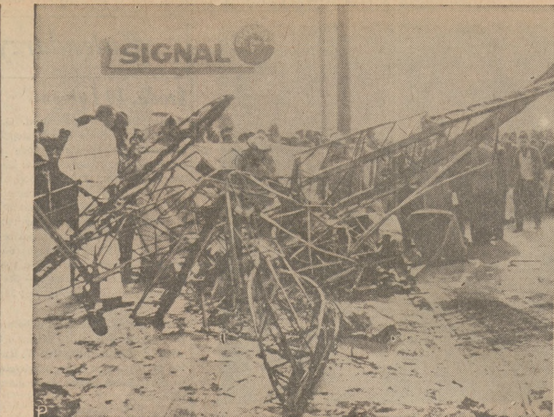
SAMOLET UPADŁ NA AUTO. W Compton, w Kalifornii lekki samolot upadł z całym impetem na zaparkowane auto, przyczem nastąpiła natychmiastowa eksplozja zbiornika samolotu. Śmierć ponieśli — pilot oraz kierowca auta. Oto szczątki samolotu powyginiane od żaru. Jak się okazało, pilot uprzednio doznał ostrego ataku serca.

Problem wypadków drogowych jest jednym z wielkich nierozwiązanych problemów społecznych naszej doby —