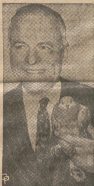
GOLAB PASAŻEREM. W odległości 800 mil od wybrzeża Stanów Zjedn. na włoskim statku pasażerskim płynącym do Włoch schwytano gołębia, który miał obraceć z nazwiskiem właściciela swego w Seybrook, Conn. Na zdjęciu ambasador Stanów Zjedn. do Hiszpanii, John Lodge, który jadąc do N. Yorku gołębia tego przywiózł z sobą.