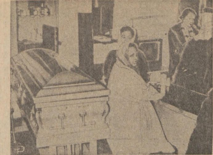
LUDDY NIC W CHICAGO NIE WZRUSZA. - W jednej z restauracji w Chicago ludzi nie wzrusza fakt, że tuż obok kontuaru, przy którym zjadali, stała trumna ze zwłokami wewnątrz. Przyczyną umieszczenia trumny w restauracji był pożar w sąsiednim domu...

Instalacyjne Posiedzenie Gminy 41 ZNP, odbyło się w środę 3-go lutego, w sali Bartnicka, 2110 N. Damen Avenue, przy licznej udziale Delegacji.