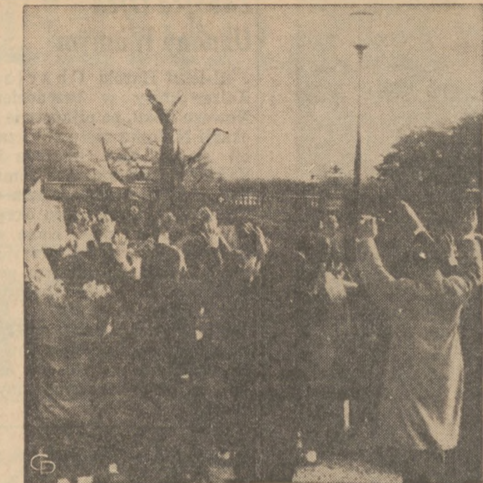
RADOŚĆ W JAPONII. — Załączona rycina przedstawia radość mieszkańców Japonii po ogłoszeniu w Tokio wiadomości o narodzinach syna dla następcy tronu Akihito i jego małżonki Księżniczki Michiko.

Zostań abonentem "Dz. Związkowego" jeśli nim dotychczas nie jesteś.