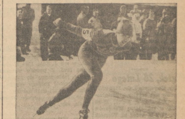
NEW WORLD RECORD—Russia's Lidija Skoblikova flies around the Olympic speed oval to set a new world record of 2:25.2 for the 1,500-meter event.