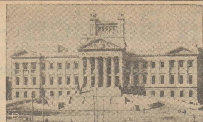
SIEDZIBA RZĄDU W MONTEVIDEO, URUGUJ. — Oto siedziba rządu kraju Urugwaj, w stolicy Montevideo, gdzie zawiązał Prezydent Eisenhower w czasie swej podróży do krajów Ameryki Łacińskiej. Urugwaj jest rządony przez Radę złożoną z 9-ciu osób, która wybiera swego przewodniczącego, drugą osobę po Prezydencie, w tamtym kraju.

W niedzielę, dnia 6-go marca, odbędzie się pierwsza instalacja Zarządu Klubu Społecznego Ba-