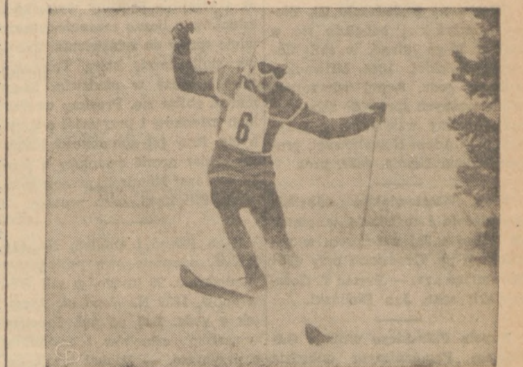
WINNING GIANT SLALOM—Switzerland's Roger Staub skitters up a spray of snow as he skids down KT-22 to cop the gold medal in the men's giant slalom. Staub, 23, covered the 56-gate course in 1:48.3. Throng of 35,000 watched the event.