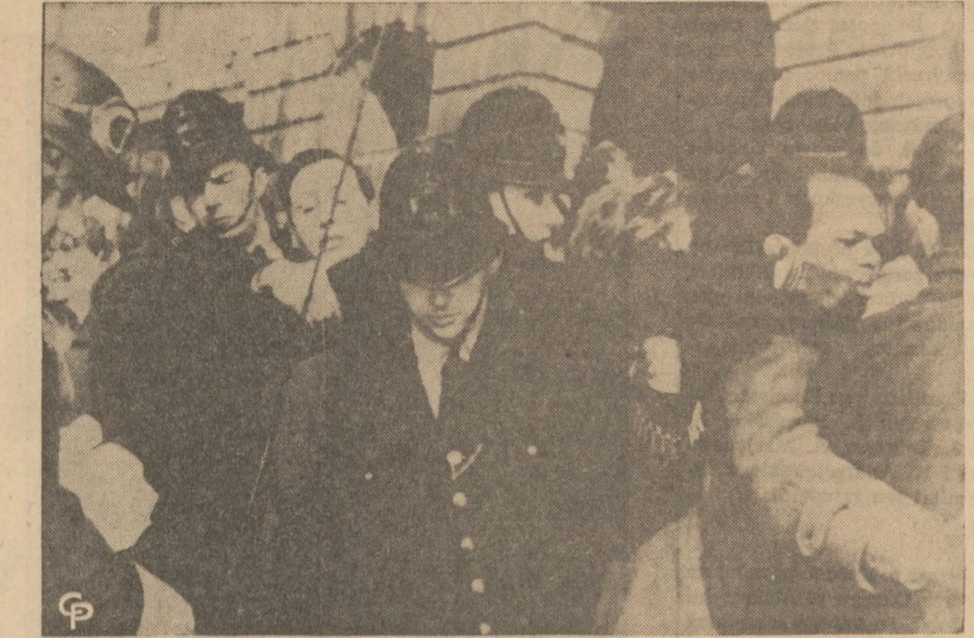
DEMONSTRACJA W LONDYNIE. Londyńscy policjanci mieli sporo kłopotu z rozpadaniem grupy demonstrantów zebranych przed gmachem "Africa House" w Londynie, protestujących przeciw zabiciu ponad 60 Afrykańczyków w czasie rozruchów w Sharpeville, w Południowej Afryce.

Bruxela (UPI). — Królewski Instytut Meteorologiczny stwierdził znaczny wzrost radioaktywności w Belgii w okresie ostatnich dni lutego. Z względu na prąd powietrzne pochodzenia tropikalnego instytut przypuszcza, że przyczyną wzrostu radioaktywności była eksplozja francuskiego ładunku atomowego na Saharze.