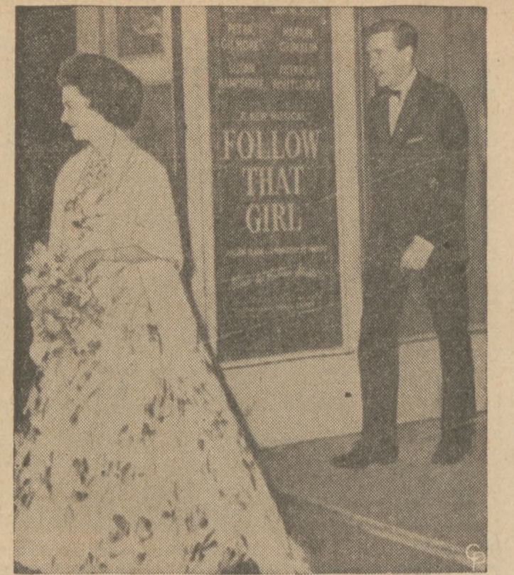
MAKSYMA NA CAŁE ŻYCIE. — Antony Armstrong, przysły mąż Księżniczki Margaret, udając się z nią na przedstawienie sztuki "Follow That Girl" w Londynie przechodzi (na zdjęciu) obok wiszącego na ścianie teatru napisu, który stał się dla niego synonimem na całe jego życie. Na zdjęciu—krocyz on za Księżniczką w odległości nakazanej kodeksem protokółowym, to jest o trzy stopy z tyłu.

APPRENTICE SERVICE MEN — LIFETIME EMPLOYMENT OPPORTUNITY FOR MEN AGE 20 TO 25 With Minimum High School Education Liberal Pay and Social Benefits While Training Must have mechanical aptitude & pass screening test OPENINGS IN CHICAGO AND BEVERLY CONTACT: The National Cash Register Co. 341 East Ohio Street Chicago PHONE: Randolph 6-2121 FOR INTERVIEW APPOINTMENT