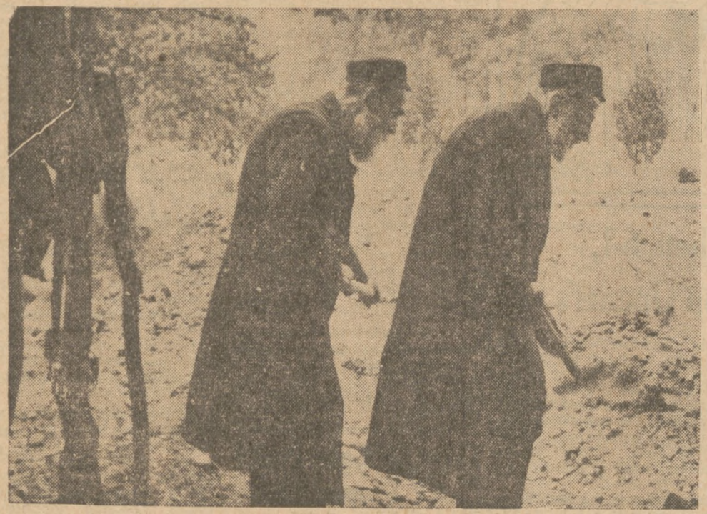
OBRONA WARSZAWY. W czasie obrony Warszawy w 1939 roku, wśród ochotników kopających okopy i rowy przeciwlotnicze nie zabrakło także i Żydów i to zarówno starszych, jak i młodych. Większość z nich zginęła w ghetto, lub w obozach koncentracyjnych.