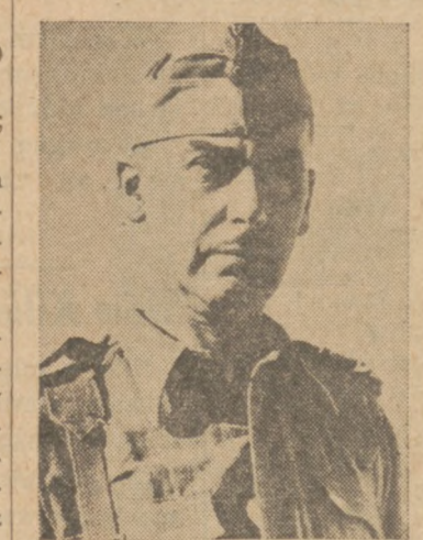
GEN. ST. KOPAŃSKI

Gen. St. Kopański urodzony w 1895 r. Do szkół średnich uczęszczał w Petersburgu, a studia wyższe kontynuował na politechnice