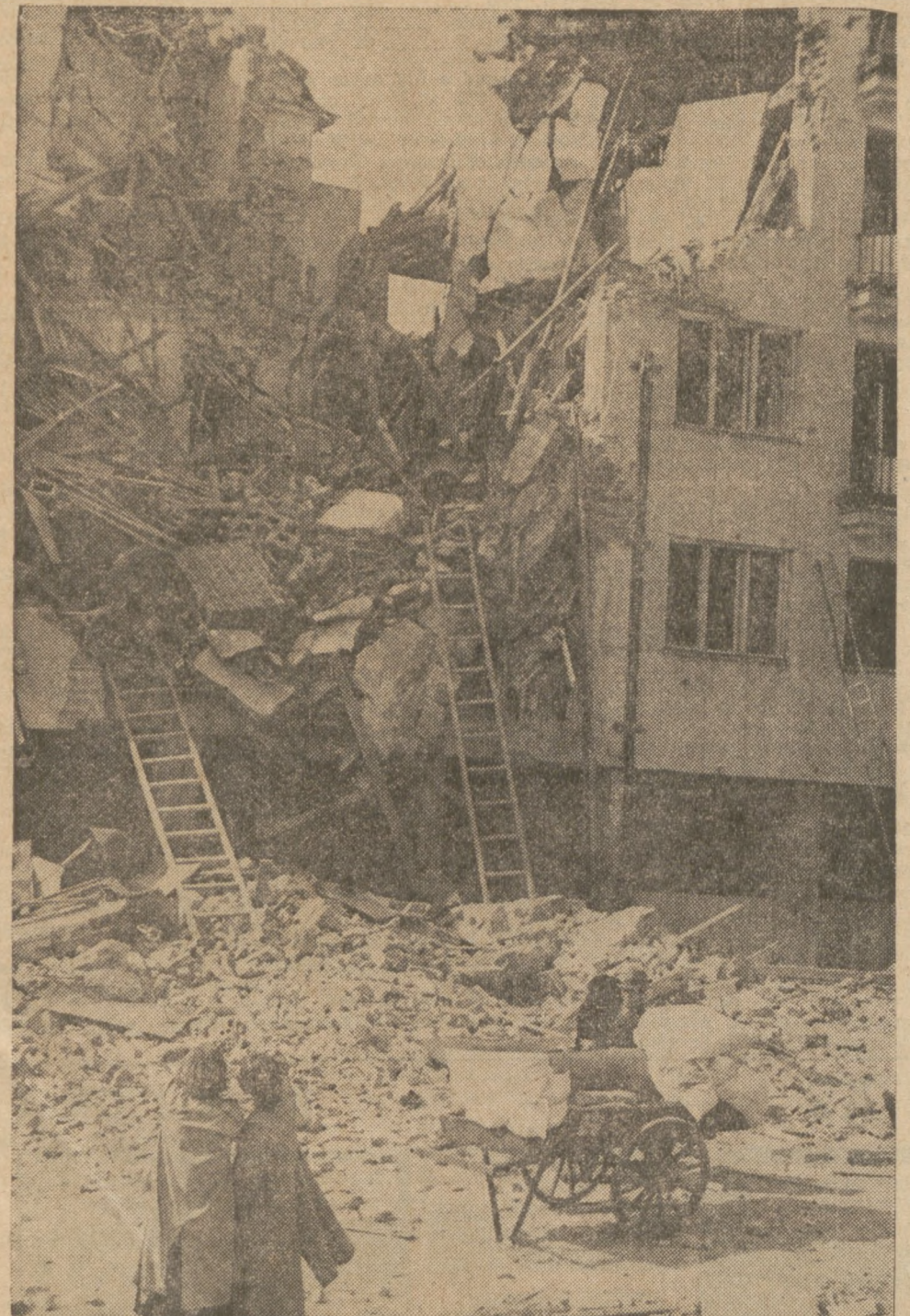
TRAGEDIE WOJNY. Piętnaście kobiet zginęło w tych gruzach w czasie jednego z pierwszych nalotów na Warszawę we wrześniu 1939 roku. Dzisiaj w tym samym miejscu stoją nowe domy mieszkalne w obudowanej przez naród Stolicy.