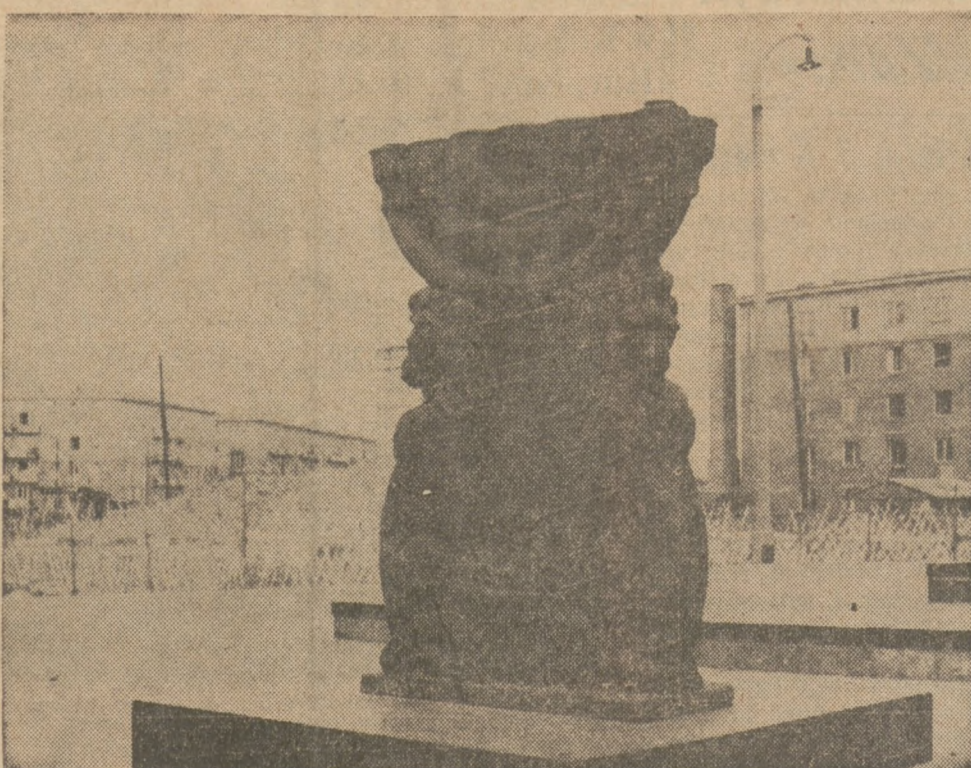
Tak wygląda obecnie dawne getto w Warszawie, będące pomnikiem hańby niemieckiej, a zarazem pomnikiem cierpienia i meczeskiej śmierci 40,000 Żydów wymordowanych w tym getcie w 1943 roku. Zdjęcie to, jeden z fragmentów filmu, jaki Julien Bryan osobiście zademonstruje w Orchestra Hall w najbliższy piątek, 1 kwietnia, o godz. 8:30 wieczorem, w sobotę, 2-go kwietnia, o godz. 2 po poł. i w poniedziałek, 4 kwietnia, o godz. 8:15 wieczorem. Film pokaże wszystkie ważniejsze miasta i ośrodki przemysłowe Polski, a w szczególności także ziemie odzyskane, a obejmuje on zdjęcia z 1936 roku, 1939, 1946 i 1959.

Bilety w restauracjach Lenarda i Stodkowskich oraz w Orchestra Hall.