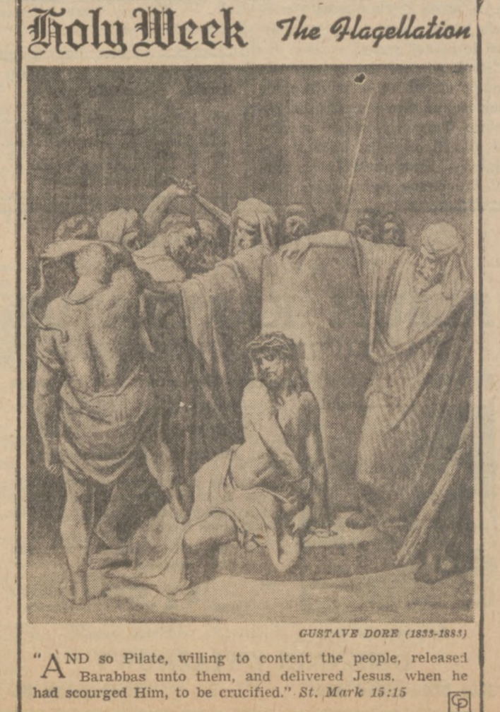
GUSTAVE DORE (1858-1888)