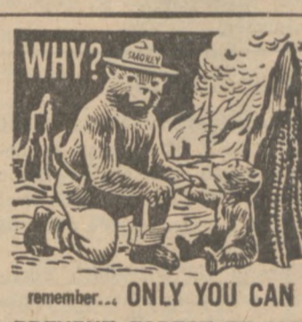
remember... ONLY YOU CAN PREVENT FOREST FIRES!

AND so Pilate, willing to content the people, released Barabbas unto them, and delivered Jesus, when he had scourged Him, to be crucified. St. Mark 15:15