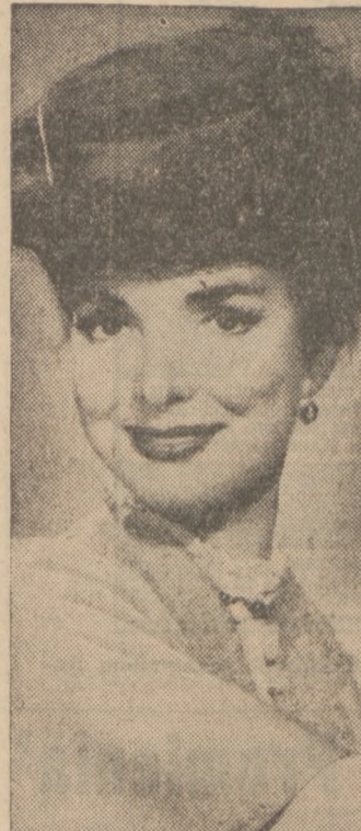
VICTORIAN... Lovely Elisabeth Sellers wears this turn-of-the-century costume in MGM's suspenseful new drama, "The Day They Robbed the Bank of England," in which she stars opposite Aldo Ray.