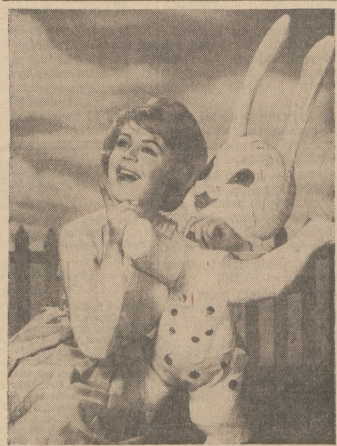
Actress Sandra Dee and her long-eared companion above welcome Easter in a traditional pose. Sandra, recently named Number One Star of Tomorrow in polls conducted by film industry trade publications, plays her most unique screen role to date—that of the "voice" of the young heroine in "The Snow Queen," a feature-length animated cartoon in color based on Hans Christian Andersen's most popular fairy tale.