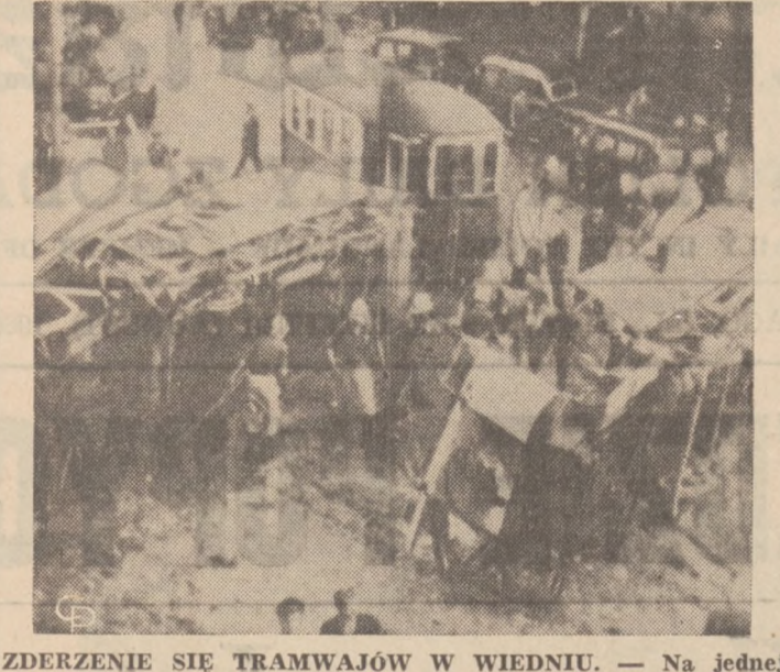
ZDERZENIE SIĘ TRAMWAJÓW W WIENIU. — Na jednej z ulic w Wiedniu doszło do zderzenia się dwóch tramwajów, wypełnionych pasażerami. 17 osób zostało zabitych, a 30 znajduje się w szpitalach w krytycznym stanie.

(Dokończenie ze str. 1-szej) stej i prywatnej inicjatywy, więc zasięga za wiele osiągnąć spada przede wszystkim na ogół. Więc jedną z największych zasług Iki jest to, że wlał otuchę i spokój o przyszłość w duszę narodu i natężył go do twórczości ekonomicznej!