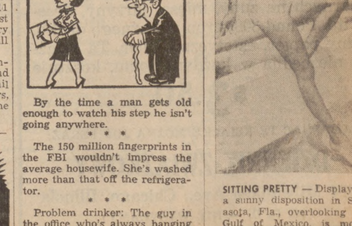
SITTING PRETTY — Displaying a sunny disposition in Sarasota, Fla., overlooking the Gulf of Mexico, is model Sandee Noel.

Parents are those people who bear infants, bore teen-agers and board newlyweds.