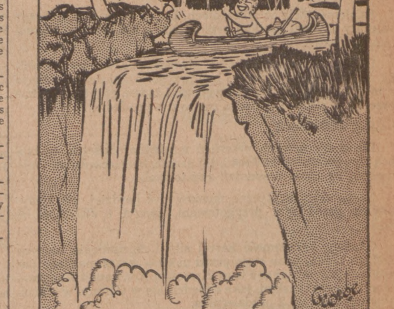
"I wonder if the slaves down at the office are managing to keep cool?"