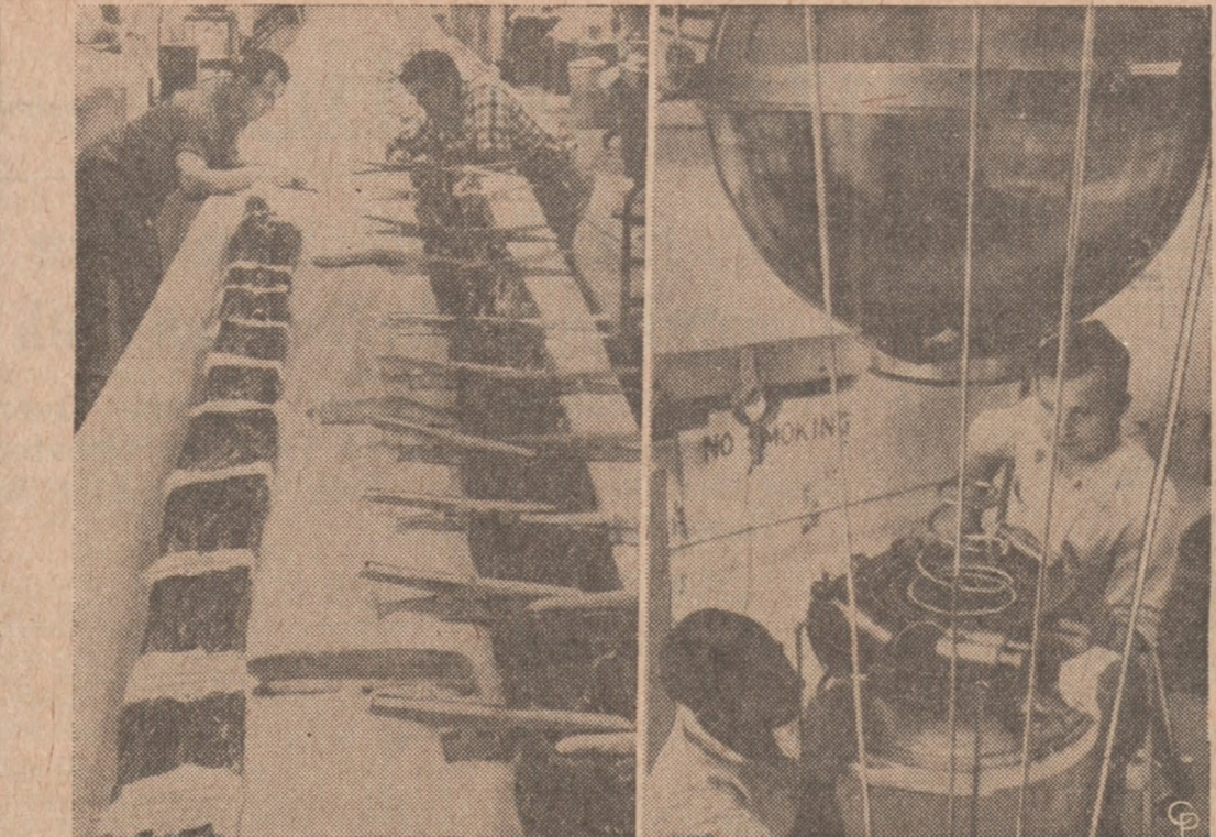
BALON ECHO I OTWIERA NOWĄ ERĘ W KOMUNIKACJI . — 100-stopowy balon Echo I — "Zwierciadło ehowe," którego można widzieć w nocy na południowo-wschodnim nieboskłonie, stanowi nową erę w komunikacji fal radiowych. Mogą się one odbijać jak od zwierciadła i być

Organizacja, do której należą wyłącznie tylko policjanci miejscowi, znana pod nazwą St. Jude's League — Liga św. Judy — będzie miała w tę niedzielę swój doroczny piknik na gruncach St. Jude's Seminary, w Momence, Illinois.