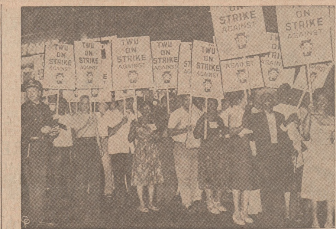
NA STACJI KOLEI PENNSYLVANIA W NEW YORKU.—Oto długi szereg pikietujących, ustawionych na stacji kolejowej Pennsylvania Railway, po wyjściu około 20,000 pracowników tej kompanii kolejowej na strajk. Jest to pierwszy strajk w tej kompanii od 114 lat. System Pennsylvania rozciąga się od New Yorku aż po St. Louis i stanowi największą transportową kompanię w Stanach Zjednoczonych.