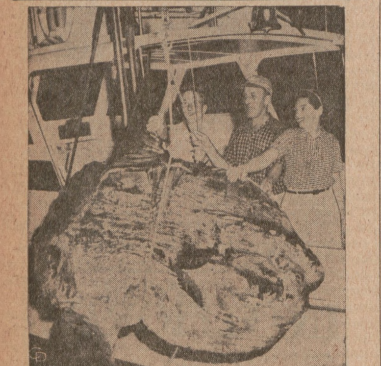
USTRZELENIE POTWORNEJ RYBY MORSKIEJ. — W rejonie Revere, w stanie Massachusetts ustrzelono w morzu potworną rybę morską zwaną oceanicznym "Sun-Fish". Potwór ważył 1.800 funtów i był zastrzelony 3-ma harpunami. Dwa harpuna odbiły się od potwora, dopiero trzeci był dla niego śmiertelnym.

Gomułka nigdy jeszcze na Zachodzie nie był i powojennego świata wolnego nie widział. Weźmie on udział w "czerwonej podszycie w cę", jaką najwidoczniej nakazał sowiecki premier Nikita Chruszczow na eksterytoryalnym skrawku ziemi Narodów Zjednoczonych.