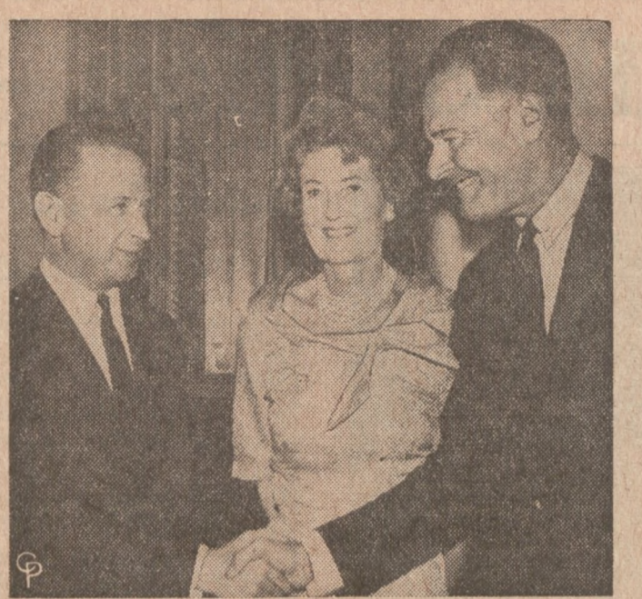
POŻEGNANIE AMB. ZN. HENRY C. LODGE'A.—W Nowym Yorku odbyła się pożegnalna przyczystość poświęcona dla odchodzącego z funkcji ambasadora Stanów Zjedn. do Zjedn. Narodów, Henry Cabot Lodge'a. Na pożegnaniu to ambasador Lodge przybył z małżonką (na zdjęciu). Żegnał on w imieniu Zjedn. Narodów sekretarza gen. ZN, Dag Hammarskjöld. W pożegnaniu wzięło udział ponad 1700 dyplomatów i członków organizacji ZN. Cabot Lodge ma obecnie rozpocząć swą kampanię wyborczą jako kandydat Republikański na stanowisko Wiceprezydenta.