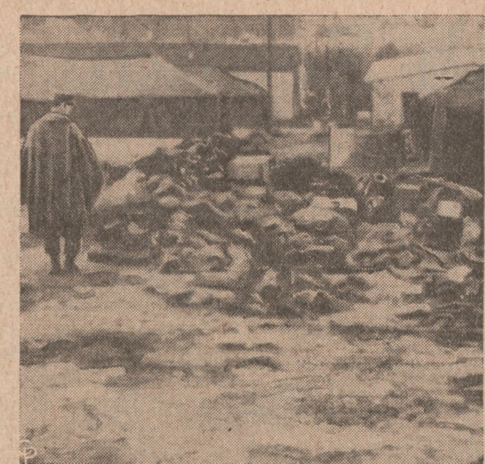
WYPADEK NA MANEWRACH AMERYK. W NIEMCZECH.— Oto widok rozbitego namiotu z amerykańskim oddziałem rozpoznawczym, do którego wpadł wyszczelony pocisk artyleryjski i zabił przy wybuchu 15 żołnierzy amerykańskich i zranił 28. Manewry urządziła 3-cia Dywizja Pancerna w Bawarii.