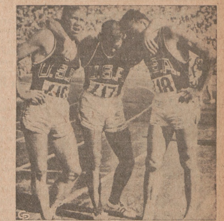
3 MEDALE DLA USA W JEDNEJ KONKURENCJI. — Oto trzej zawodnicy amerykańscy, którzy na Olimpiadzie w Rzymie, w biegu z płotkami na 400 mtr. odnieśli pełne zwycięstwo zajmując pierwsze, drugie i trzecie miejsce. Są to Glenn Davis (w środku) oraz Cliff Chushman (z lewej) i Dick Howard.