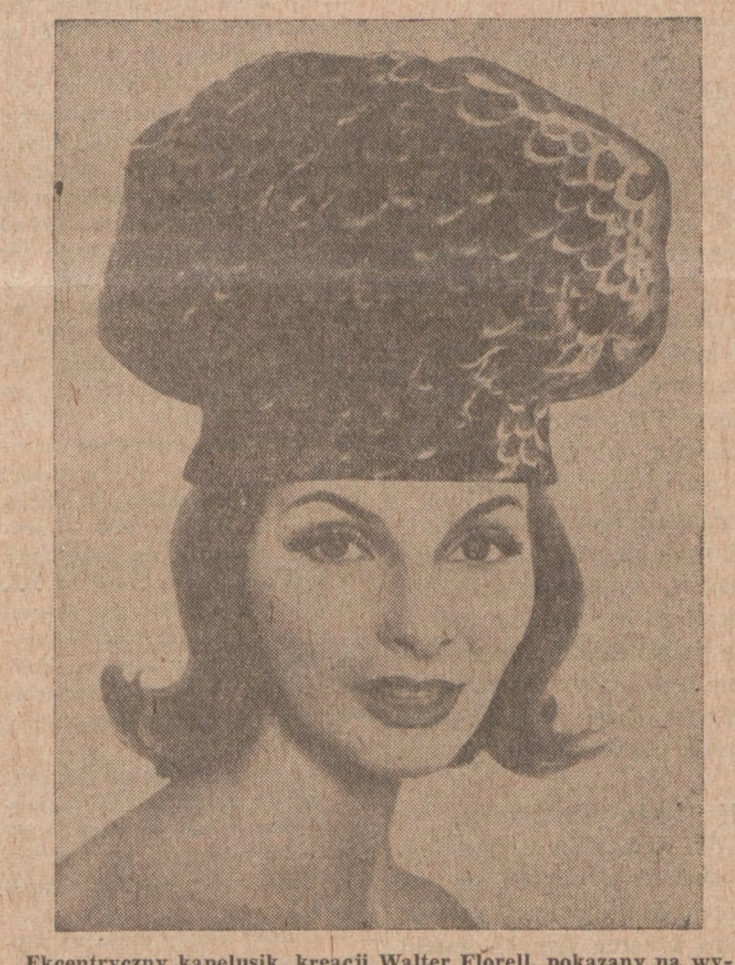
Ekcentryczny kapelusik, kreacji Walter Florell, pokazany na wystawie mód w Nowym Yorku. Kapelusik uszyty jest z welwetu z malowanym deseniem piór ptasich.

Dobroć flaczek zależy od ugotowania; muszą być tak miękkie, aby rozgniatyły się w palcach; pokrajając je wówczas w drobny makaron; oddzielnie udusić pod pokrywą drobno uszatkowane jarzyny. Gdy miękkie, zmieszać z flaczkami; wyspać przesłane korzenie i wlać zaprawkę z masła, mąki i udużonej cebuli, rozprowadzić rosołem z flaków, posolić i gotować jeszcze pół godziny. Wyłożyć na głęboką salaterkę, posypać parmezanem i zrumienioną bułeczką. Użyć można rosołu z oddzielnie ugotowanego mięsa zamiast tego, w którym gotowały się flaki. Zrobione dokładnie podług tego przepisu są bardzo dobre.