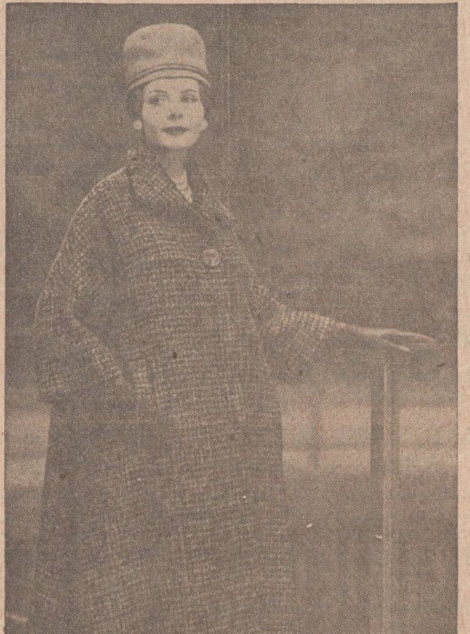
Bardzo ładny i szeroki płaszcz jesienny z materiału "tweed" w kratkę koloru białego i czarnego.

PEACH BUTTER Yield: about 10 medium glasses (5 lbs. butter) 4 1/2 cups prepared pulp (about 3 3/4 lbs. fully ripe peaches) 5/8 cups sugar 1/4 cup firmly packed brown sugar 2 tablespoons lemon juice 1/4 teaspoon lemon rind 1/4 teaspoon cinnamon 1/2 teaspoon ginger 3/8 teaspoon cloves 1 box (1 1/4 oz.) Sure-Jell powdered fruit pectin First, prepare the fruit. Peel and pit about 3 3/4 pounds fully ripe peaches and chop or crush. Bring to a boil and simmer, uncovered, 10 minutes. Put fruit pulp through sieve. Then make the butter. Measure the sugars and set aside. Measure 1/2 cups pulp into a very large saucepan. Add lemon juice and rind, cinnamon, ginger and cloves. Add powdered fruit pectin and mix well. Place over high heat and stir until mixture comes to a hard boil. At once stir in white and brown sugars. Bring to a full rolling boil and boil hard 1 minute, stirring constantly. Remove from heat, skin off foam with metal spoon, and ladle quickly into glasses. Cover butter at once with 1/8 inch hot paraffin. Note: This butter may set slowly.