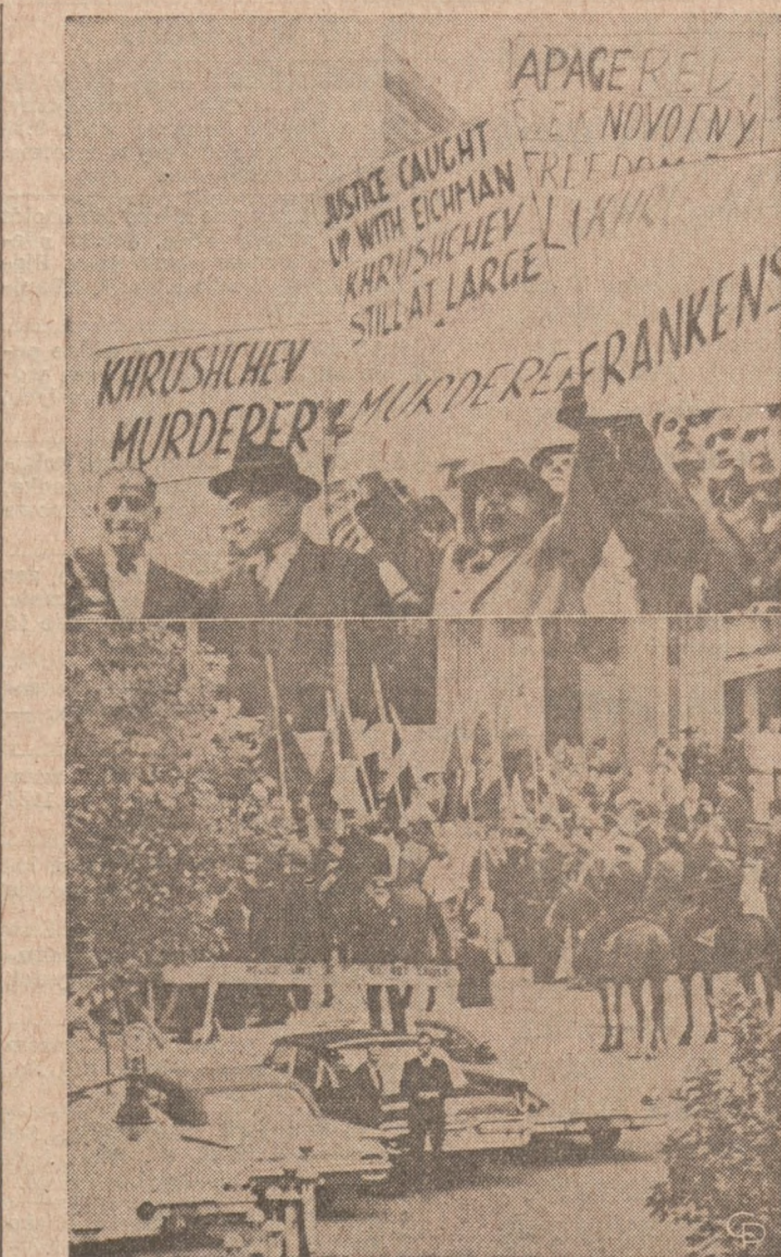
TKWIA TRANSPARENTY PRZED GMACHEM NZ.—Przed wejściem do gmachu Narodów Zjedn. w New Yorku tkwiła transparentów świadczących wymownie o "sprawiedliwości świata komunistycznego" i o "pokój miłującym" przywódco jego, Nikicie Chruszczowie. U góry — kilka z wybranych napisów. — u dołu standardy państw, wolnych niegdys dziś znajdujących się pod butem Sowietów, trzymane w rękach demonstrujących.

Przyjaciele mieli mu pomagać Churchman ujawnił, że — gdy próbował później wykazywać, że aczkolwiek Accardo zażądał wstępnej pen-