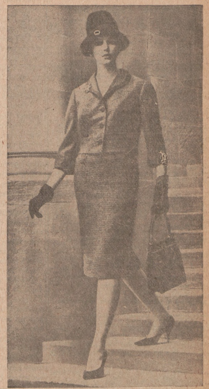
Wygodny i praktyczny kostium z wełny, posiada krótkie rekawy sięgające lekko poniżej łokcia.