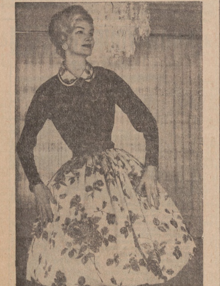
Ładna sukienka podnosząca urok młodej pani. Staniczek sukienki uszyty jest z czarnego welvetu, a spódniczka i kołnierzyk z białego welvetu w deseni kwiatów.

Makes 6 servings. *You may use two chicken bouillon cubes dissolved in 3 cups boiling water.