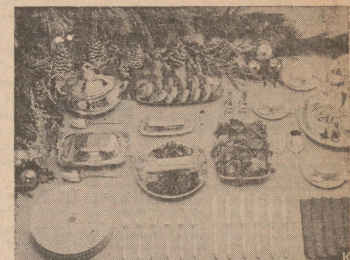
Pięknie zastawiony i przybrany stół na przyjęcie rodzinne w okresie świątecznym.