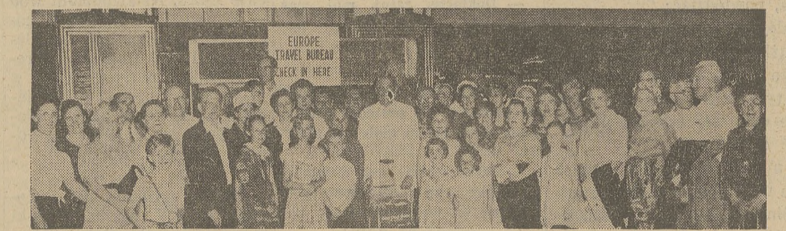
Uczestnicy Wycieczki Okrętovej Europe Travel Bureau w Chicago Na La Salle Station.