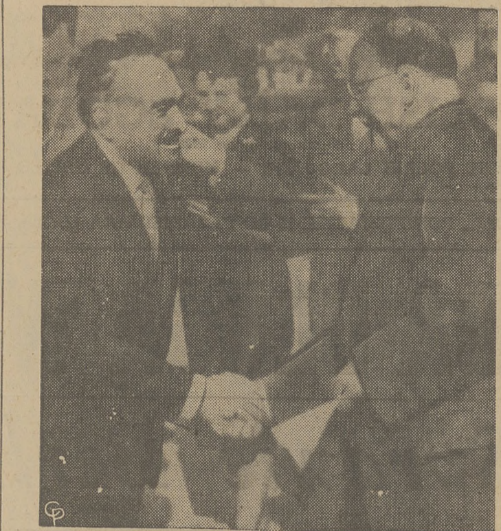
MIKOYAN WE WSCHODNIM BERLINIE. — Wicepremier sowiecki Anastas Mikoyan (z lewej) przybył do Wschodniego Berlina, witany tam przez przywódcę komunistycznych Wschodnich Niemiec Waltera Ulbrichta (z prawej)—12tą rocznicę istnienia tego reżymowego "tworu" Niemiec. Mikoyan w swej mowie zapowiedział, że już w bardzo krótkim okresie czasu nastąpi podpisanie oddzielnego traktatu pokojowego z Wschodnimi Niemcami.

Wypełnijcie ten kupon przy zamawianiu wzorów, adresu: — Dziennik Związkowy, 1201 Milwaukee Ave., Chicago 22, Illinois.