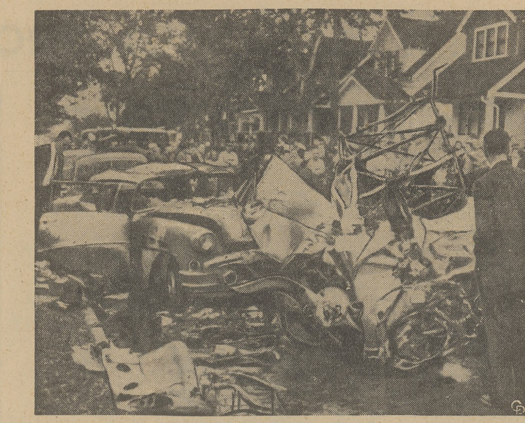
SAMOLOT SPADE NA ULICĘ W DETROIT. — Na ulicy w Detroit, Mich. spadł samolot dwusilnikowy, rozbijając się doszczętnie. Pilot i jego pasażer zostali ranni. W samolocie zabrakło paliwa i pilot nie zdolał już doprowadzić go na lotnisko znajdujące się w odległości 300 jardów od miejsca przymusowego lądowania na jezdni.

Na terenach nawiedzonych najsilniej powodzią rząd rozdał już 4,000 ton ryżu.