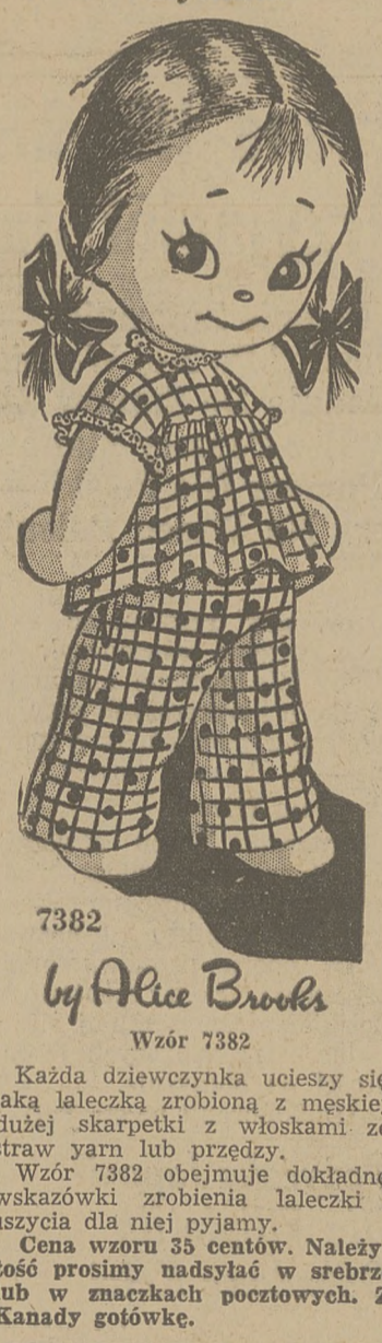
7382 by Alice Brooks Wzór 7382

Każda dziewczynka ucieszy się taką laleczką zrobioną z miękkiej dużej skampek z włoskami ze strawy jarm lub przędzy.