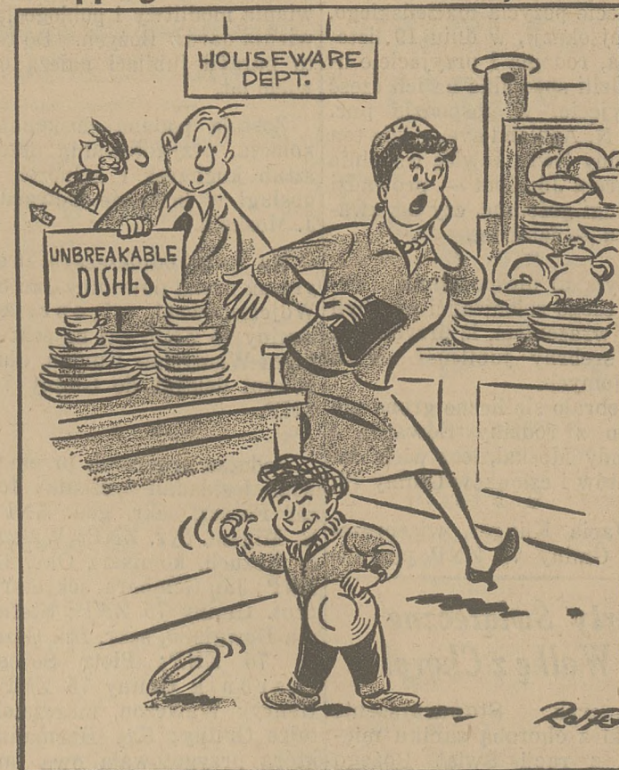
"Oh, dear! Signs like that are always a challenge to junior!"