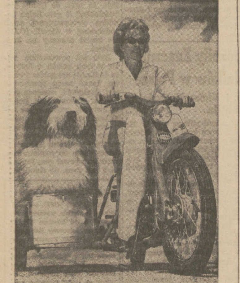
PSY LUBIĄ PRZEJAZDZKI. W Las Vegas, Nevada, uwagę na ulicach zwraca angielski owczarek o długiej sierści, zwany Zero Zero, który jeździ w przyczepce za swą panią na codzienne przejażdżki. Zwierzęta a zwłaszcza psy bardzo lubią jeździć z aucie. Zero Zero o sportowym duchu angielskim woli jednak przejażdżki w przyczepce motocyklowej.