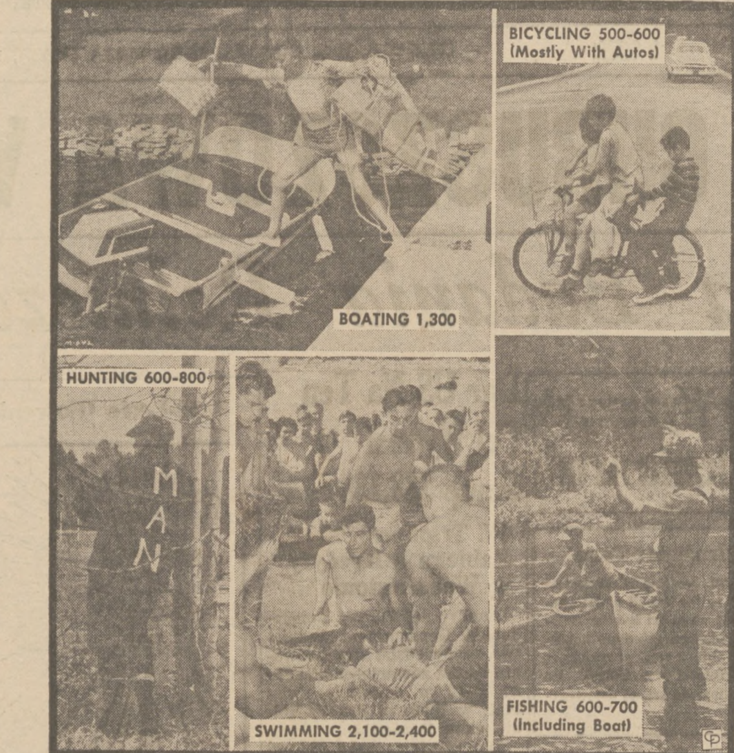
PRZYJEMNE TO, ALE NIEBEZPIECZNE.—Zaczyna się okres letni, a z nim rozmaite rozrywki i przyjemności na otwartym powietrzu, dla młodych i starszych. Znawcy jednak ostrzegają, iż za przyjemność tę można zapłacić kalem lub nawet śmiercią. Na każdym ze zdjęć powyższych podana jest liczba roczna wypadków fatalnych.

Lęklivym przyjacielom w kraju przypominamy, — że wszyscy jesteśmy zgodni co do tego, że normalizacja stosunków z Rosją jest konieczna, ale jej nie osiągnięcie z pozycji kłęczącej. Wstępem do jakiegokolwiek uczciwego dialogu — jest wyjaśnienie krwawej przeszłości do końca. — Redakcja "Kultury".