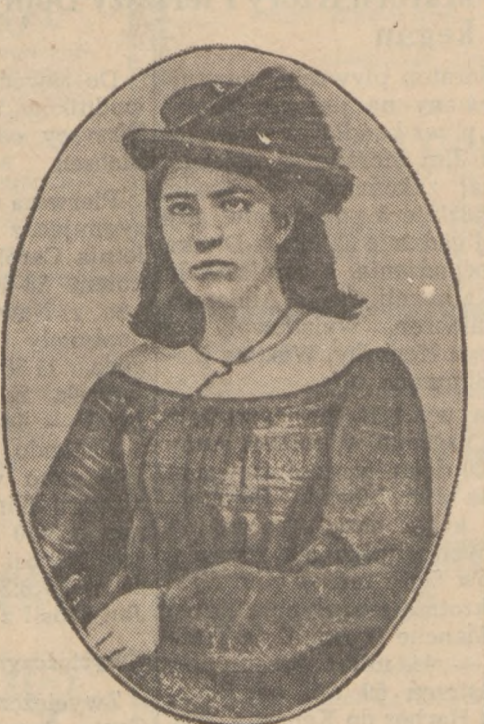
[1] Nancy Hart—a photo said to have been taken while she was a prisoner at Summersville. She was in feminine garb instead of soldier uniform, at the insistence of a young telegrapher who had become smitten with her. The hat was a soldier cap on which a feather had been fixed.