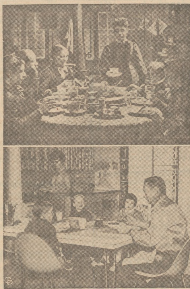
POSILEK — DAWNIEJ I TERAZ. — Górne zdjęcie przedstawia rodzinę 70 lat temu, gdy spożywa śniadanie w pokoju, który służył jako jadalnia i zarazem kuchnia. Pozywienie było skromne i monotonne i więcej czasu spędzano na przyrządzaniu potraw. Wówczas jak podają dociekania Departamentu Rolnictwa ludność spożywała tyle mięsa co dziś, ale mniej produktów mlecznych, jarezyn i konserw owocowych. Obecna rodzina w nowoczesnej kuchni (zdjęcie dolne) ma do wyboru żywność w sezonie czy poza sezonem. A przyrządzenie tych potraw wymaga mniej czasu, niż 70 lat temu.