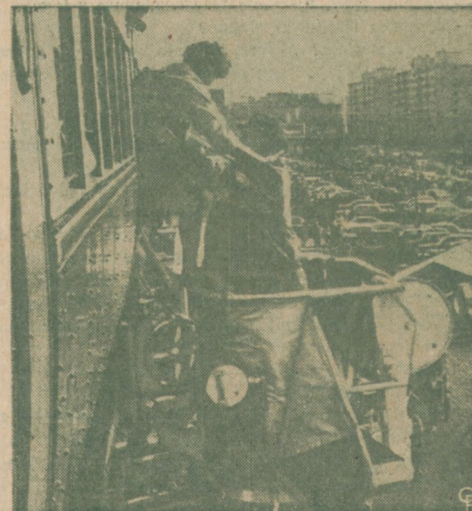
OCALONA Z PŁONĄCEGO POCIĄGU. — Strażacy pomagają pasażerów płonącego pociągu zejść przy pomocy strażackiej drabiny ruchomej zwanej "Snorkel". Akcja ratunkowa strażaków ocalała około 700 pasażerów. Narazie nie ustalono przyczyn pożaru w nadgórznej kolei w Chicago.