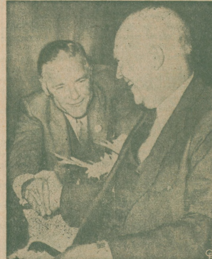
EISENHOWER W BOSTONIE. — Były prezydent Dwight D. Eisenhower (po prawej) witany jest przez byłego ambasadora do Narodów Zjednoczonych Henry Cabot Lodge podczas bankietu $100 za podanie na rzecz funduszu Partii Republikańskiej w Zbrojowni Commonwealth Armory w Bostonie. Podczas bankietu Eisenhower silnie zaatakował "smutny rekord polityki zarządzonej bieżącej administracji za ubiegłe 21 miesięcy". "Jest zbyt smutnym, aby o tym mówić", powiedział.