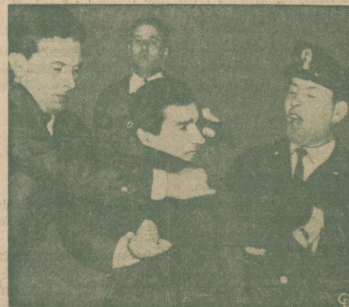
DEMONSTRACJE W RZYMIE. — Policjant (po prawej) wstrzymuje studenta demonstrującego w Rzymie przeciw uwieszeniu w Hiszpanii trzech studentów, występujących przeciw reżymowi dyktatora Francisco Franco.