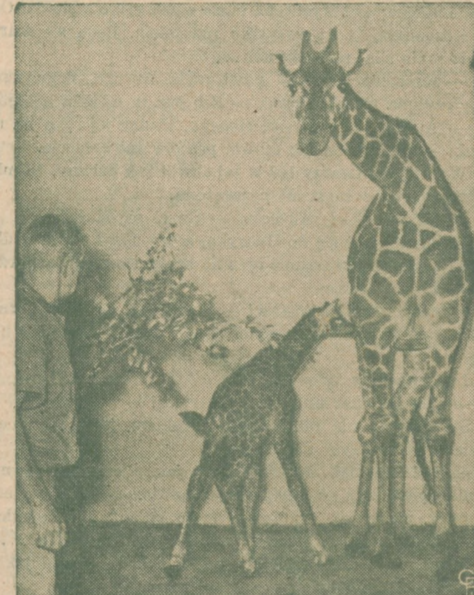
NOWY NABYTEK W OGRODZIE ZOOLOGICZNYM. — W ogrodzie zoologicznym Brookfield w Chicago wielką uciechę sprawia widok młodej żyrafy, przezwanej "Admiral", która waży 160-funtów i znacznie mniejsza od dorosłej żyrafy.