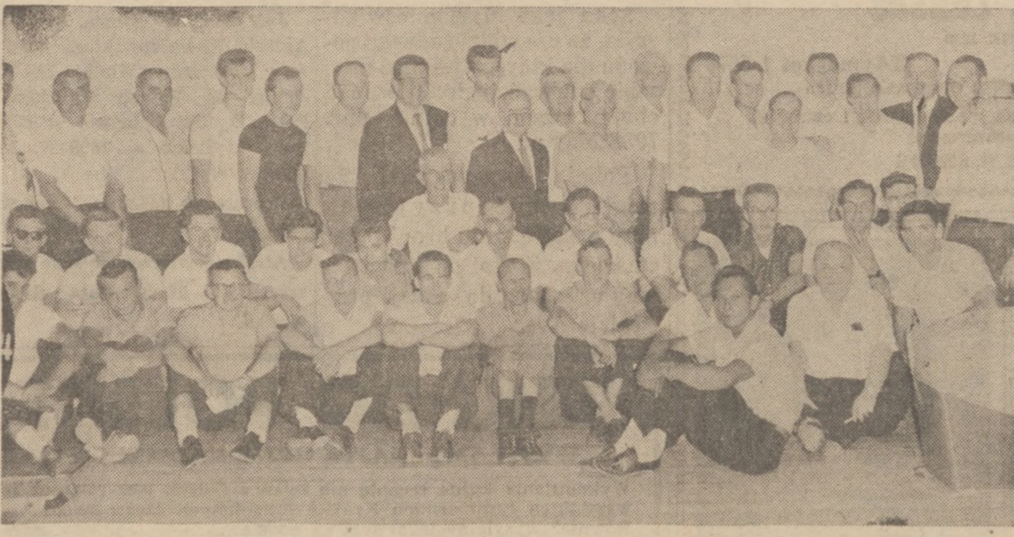
The 8-team Council 123 PNA Bowling league inaugurated its 1962-63 title campaign on September 9, 1962, at the new bowling lanes located at 51st-Aberdeen Streets.