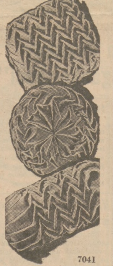
Wzór 7041 by Alice Brooks

Poduszki takie należą obecnie do najmodniejszych. Są one robione tak zwanym "smock" ściąganiem. Do zrobienia można użyć corduroy, velvetu, atlasu lub bawełnianego materiału.