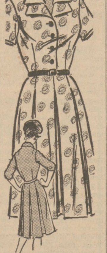
Wzór 4571 by Anne Adams

Zgrabna uszczuplająca sukienka z krótkimi lub długimi rękawami i ze spódniczką układaną w fałdy. Stosowna na wszelkie okazje.