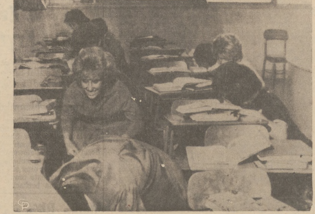
ĆWICZENIA OBRONY CYWILNEJ W SZKOLACH.—Wypadki ostatnie i blokada Kuby naładły ćwiczeniem ochronnym, przeprowadzonym w szkołach w całym kraju, charakter bardziej "żywy". Oto fragment z ćwiczeń chronienia się przed wybuchem bombowym, w Wyższej Szkole Mount Miguel, w Spring Valley, w Kalifornii.

Integracja polega na wyrzeczeniu się przez emigranta swojej odrębności narodowej i kulturalnej oraz kompletnej asymlacji w nowym środowisku.