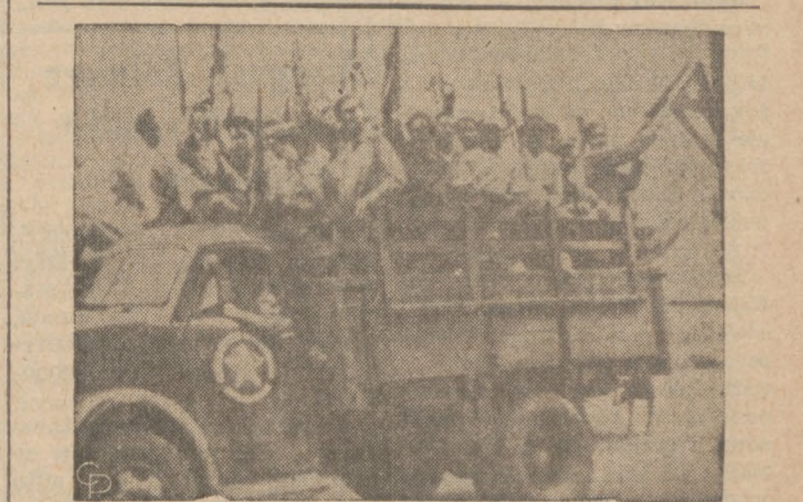
MOBILIZACJA NA KUBIE.—Kuba, po zarządzeniu przez premiera Fidela Castro ogólnej mobilizacji, zarobiła się od licznych aut ciężarowych wypełnionych wojskiem. W kraju panuje psychoza, że Stany Zjednoczone mogą dokonać inwazji wyspy dla zlikwidowania baz rakietowych o charakterze wyraźnie ofensywnym przeciw Stanom Zjednoczonym.

Umieszczenie na przedmiotach posiadanych — ukrytej identyfikacji może wydawać się — jak zaznacza policja — rzeczą małą, ale jakże wielkie ma znaczenie!