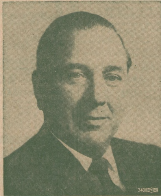
RICHARD J. DALEY Mayor m. Chicago