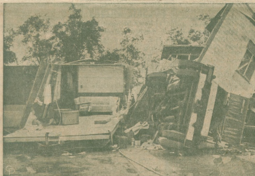
JEDEN Z WIELKICH ORKANÓW , które ostatnio nawiedziły Florydę zniszczył cały park trailerów, wyrządzając szkody na $75,000.