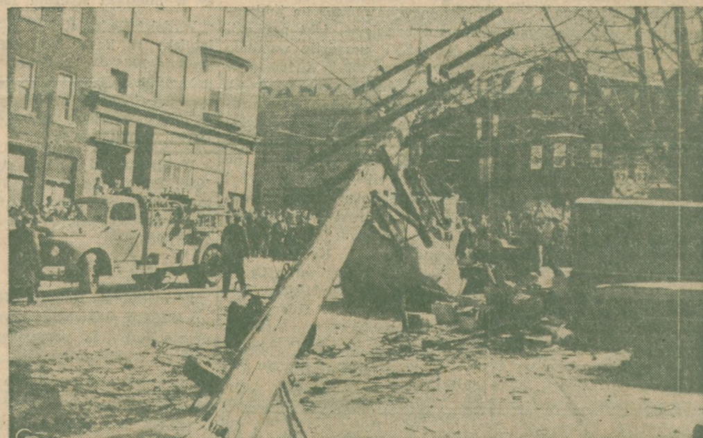
TRZY OSOBY ZOSTAŁY ZABITE , gdy samochód ciężarowy zjechał z jezdni i rozbił się na chodniku w centrum miasta Johnstown, Pa.