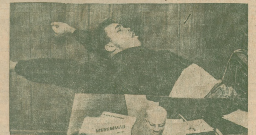
SZAMPION BOXU ciężkiej wagi Lucius Clay, członek sekty czarnych muzułmanów nie przejmując się doniesieniami o planowanym na jego życie zamachu. Policja chroni go przed niebezpieczeństwem, które wynika z walki między dwoma grupami czarnych muzułmanów, bardzo zaostrzonej po zabicu przywódcy jednej z grup Malcolma X.