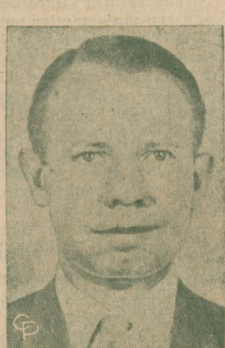
RZĄD Syrii zmusił do wyjazdu sekretarza amerykańskiej ambasady W Snowden, oskarżając go o szpiegostwo.