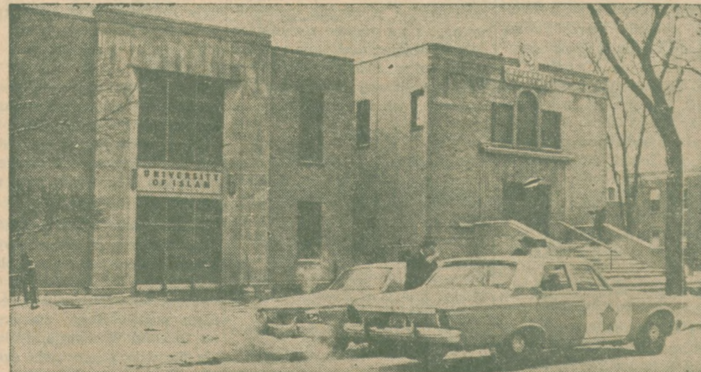
POLICJA PILNUJE świątyni muzułmańskiej i budynku Uniwersytetu Islamistycznego w Chicago wskutek doniesień, że zamierzone jest ich zniszczenie przez zwolenników zamordowanego w New Yorku Malcolma X.