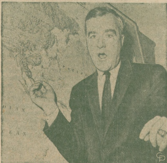
PRZED PRZEMÓWIENIEM na plenum Izby Reprezentantów, kongresman Cornelius E. Gallagher (D-N.J.) wskazuje w swym biurze na mapę Wietnamu stwierdzając, że droga do negocjacji powinna być stale otwarta, ale w obecnym czasie nie powinny być one podejmowane.