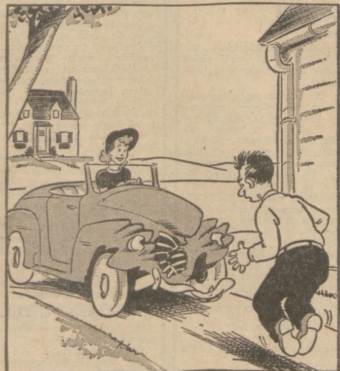
"Guess who I ran into today?"