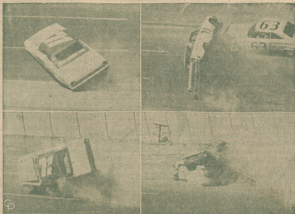
POCZĄTEK ZDERZENIA 2 AUT — w czasie wyścigów samochodowych na Daytona International Speedway w Daytona, Floryda. Nikt nie został zabity.