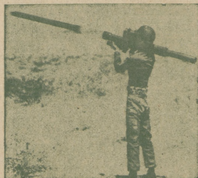
NAJMNIEJSZA WYRZUTNIA RAKIET REDEYE — operowanych ręcznie jak karabin maszynowy, jest wypróbowywana w Pomona, California. Rakiety te będą używane do zestrzeliwania nisko lecących samolotów nieprzyjacielskich.