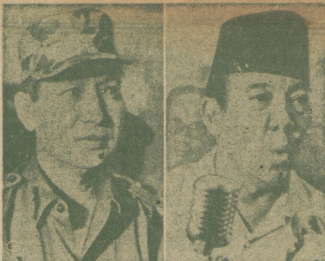
NOWY RZĄD INDONEZJI — uformowany w rezultacie antykomunistycznej presji ze strony armii, zachował prezydenta Sukarno jako figurę reprezentacyjną bez realnego wpływu. Po lewej organizator przewrotu gen. Suharto, członek sześcioposobowego prezydium rządzącego — czyli tak zwanej "junty".