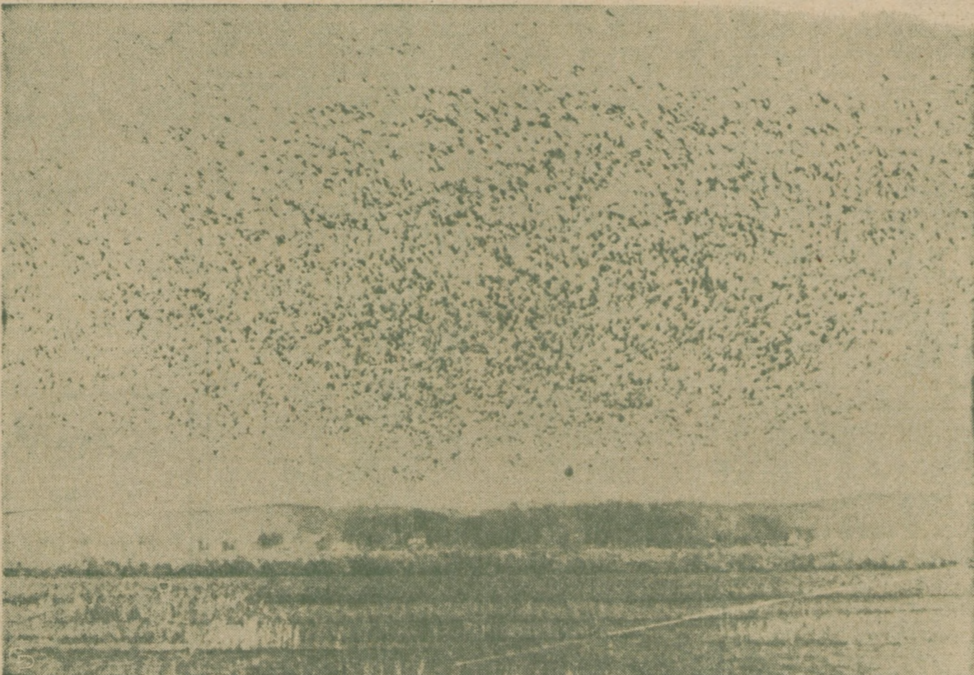
ZWIASTUN WIOSNY : mrowie dzikich gęsi nad jeziorem Forney, koło Thurman, Iowa w dorocznym locie powrotnym do Kanady na lato.