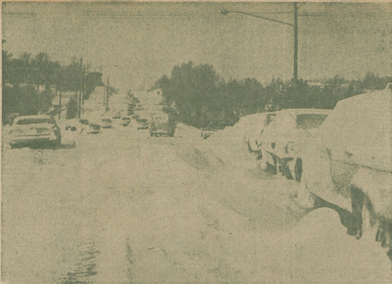
ZABÓJCZA BURZA ŚNIEŻNA — zablokowała około 100 aut na głównej arterji w Omaha, Nebraska, zmuszając 300 osób do poszukiwania schronienia w pobliskich domach.