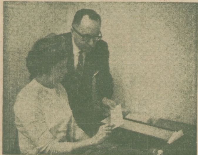
SEDZIA TADEUSZ V. ADESKO — szef powiatowego działu Sądu Okręgowego i operatorka Pearl Oehme badają niektóre z kart rejestracyjnych 1,800,000 wyborców, które zostały dostosowane do techniki komputerów. Używanie ich usprawni i ułatwi pracę sędziów wyborczych.