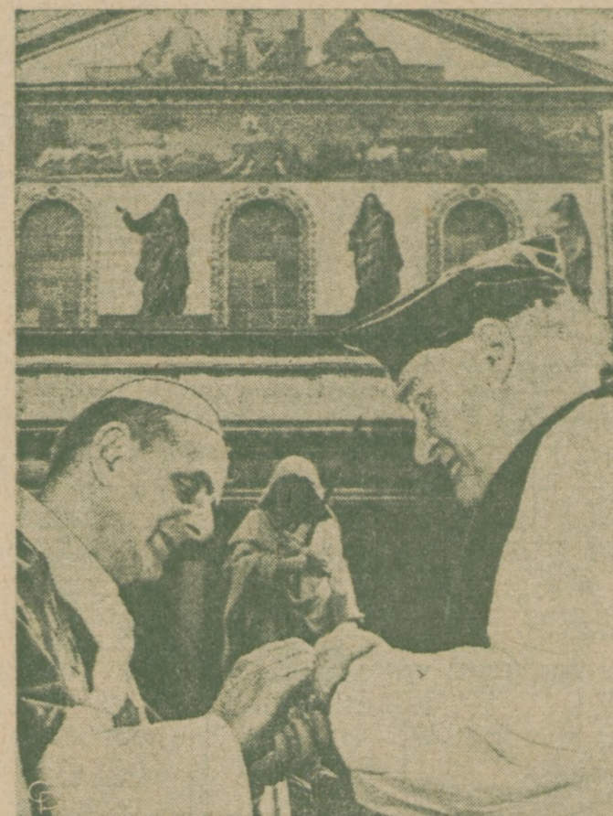
PÓ WYMIENIENIU "POCALUNKU POKOJU" z arcybiskupem Canterbury drem M. Ramsay, Papież Paweł VI wkłada swój własny "pierścień Rybaka" na palec gościa, co stanowi manifestację bez precedensu na drodze zbliżenia katolicyzmu z protestantyzmem, rozpoczętej przez Jana XXIII.

Zapisujcie Działkę Waszą Do Wydziału Małoletnich Z N P