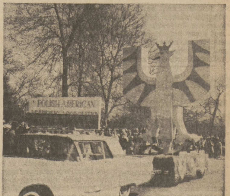
IMPONUJĄCYM BYŁ rydwan Związku Akademików Polskich w Chicago.

"W roku ubiegłym — stwierdza tygodnik — odbyło się 4,000 spotkań z oficerami radzieckimi w różnych środowiskach społeczeństwa polskiego".