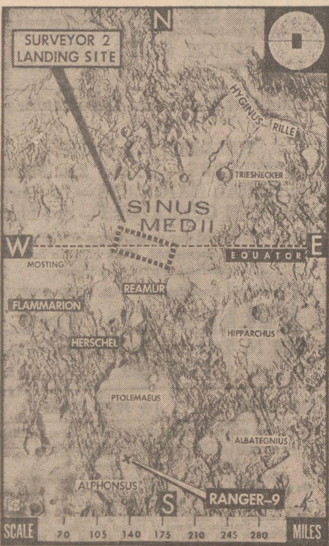
SURVEYOR 2's target on the Moon, an area 23 by 56 miles, is surrounded by craters in this Moon close-up, an overall area 525 by 350 miles. The target area is to be photographed as a possible Apollo (manned landing) site. The selenography (lunar geography) has many ridges and rilles.