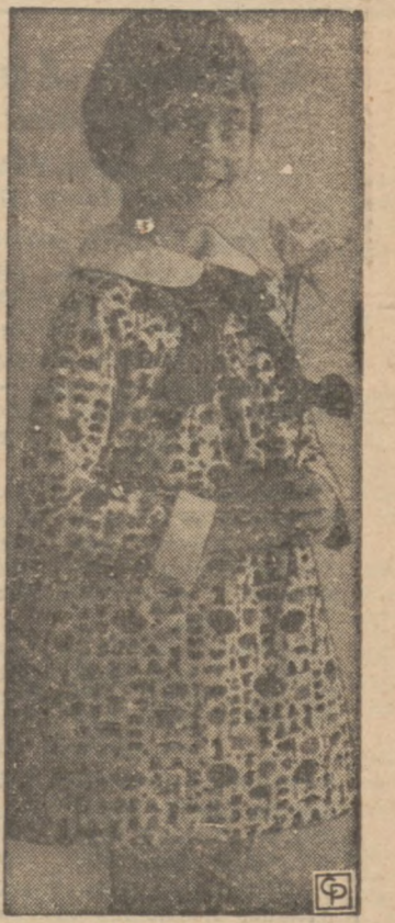
Pralna sukienka z bawełny w deseń.

— Połóż sobie na głowie, gdy nikt Cię nie widzi, ciężką książkę i próbuj pospacerować tak po mieszkaniu. Ćwiczenie to poprawia sylwetkę, sposób chodzenia i doskonale wpływa na linię szyi. Gdy dojdiesz do wprawy, będziesz mogła z powodzeniem spacerować z takim balastem, podlewając kwiaty w doniczkach, ścierać kurz, wycierać talerze.