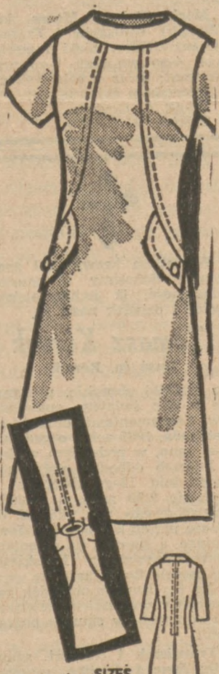
4684 SIZE 10-18 by Anne Adams Wzór 4684

Na szczęśliwe dni, wieczory. Mankietowy kołnier, potokracie stebnowanie na prozdzie, zakonczone 2 parkami na biodrach. Wybierz puszysty tweed, knits. Łatwa do uszycia.