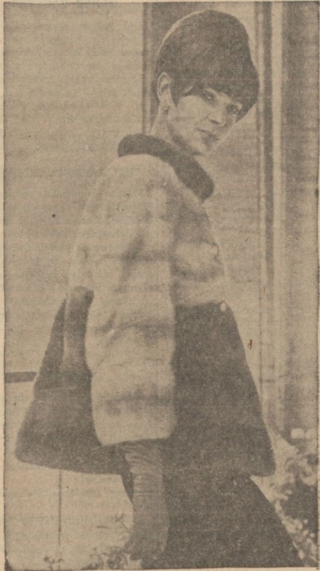
Zakieciak nurkowy w dwóch kolorach—"emba cerulean" i "lutetia."

Jednak ta "szara pospolitość" nie przytłoczyła twórczości poetki. Stężała ona teraz i zmieniła ton. Coraz głośniejsze rozbrzmiewające hasła pozytywizmu przeniknęły wrażliwą duszę poetki i znalazły wyraz w wydanych w owym okresie "Obrazkach". Treścią ich jest nędza tych najbardziej potrzebujących, z samego dna suteryni i z brudnych chat wiejskich. Te "społeczne" wiersze Konopnickiej nie są wcale "żałamywaniami rąk".