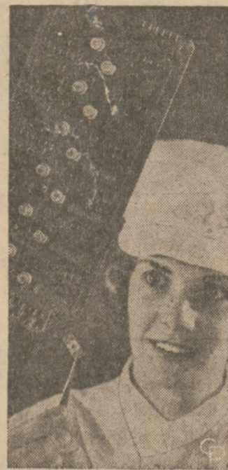
POWERFUL MIDGET —The two larger computers on the new RCA Spectra 770 series employ tiny monolithic integrated circuits (the black dot in the center of the unit held in the tweezers). Just three of these units perform the same electronic function as the larger circuit board shown—while operating at 40 times the speed.

Polish theater enjoys a great tradition dating from the 18th century period of dramatist and director Wojciech Boguslawski. After Poland's restoration in 1918 theatrical art—particularly in stagecraft—developed brilliantly under the leadership of Arnold Szyfman, Juljusz Osterwa and Leon Schiller.