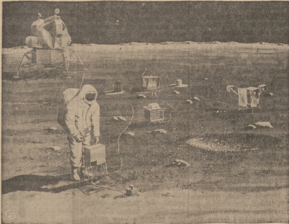
MOON BEAMS —This visualized scene shows the first Apollo-Saturn space traveler setting up his various instruments on the lunar surface to tell us more about the Moon than man ever has known before. Scientists of the Aerospace Systems Division of The Bendix Corp. say the instruments will continue to send back lunar information for about a year. The instruments will measure the intensity of lunar earthquakes, the energy of solar wind particles and the Moon's magnetic field.