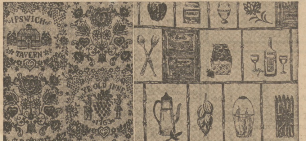
Old inn signs recall U.S. beginnings. This popular kitchen design is printed in a variety of color schemes on strippable wallcovering.