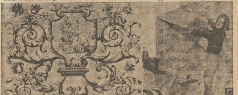
Easy to apply I-Peal permits changing decor or correcting errors quickly.

From a cave man's primitive efforts to a scientific laboratory, from French drawing rooms to modern technology, wallcoverings have come a long way in 250 years. In the 18th century, an Italian decided to use decorative book papers for covering his walls. Today the modern homemaker can choose from a variety of designs in a fabric textured covering with a new feature. It comes off even easier than it went up. This latest development by International Paper is called I-Peal. The first "mistake proof" wallcovering, it's made of cellulose fibres, special resins, and Avisco's rayon. Applied easily with regular wheat paste, it's the first wallcovering that can be stripped off to correct mistakes in matching or alignment, and the first wallcovering that can be removed to change decor without steaming or scraping. Manufactured by five different firms in a variety of patterns I-Peal is available at your favorite decorating shop.