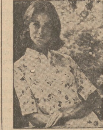
Bluzeczka bawełniana w deseń.

W noc wigilijną, pokój i cisza wchodzi do serc ludzi do-