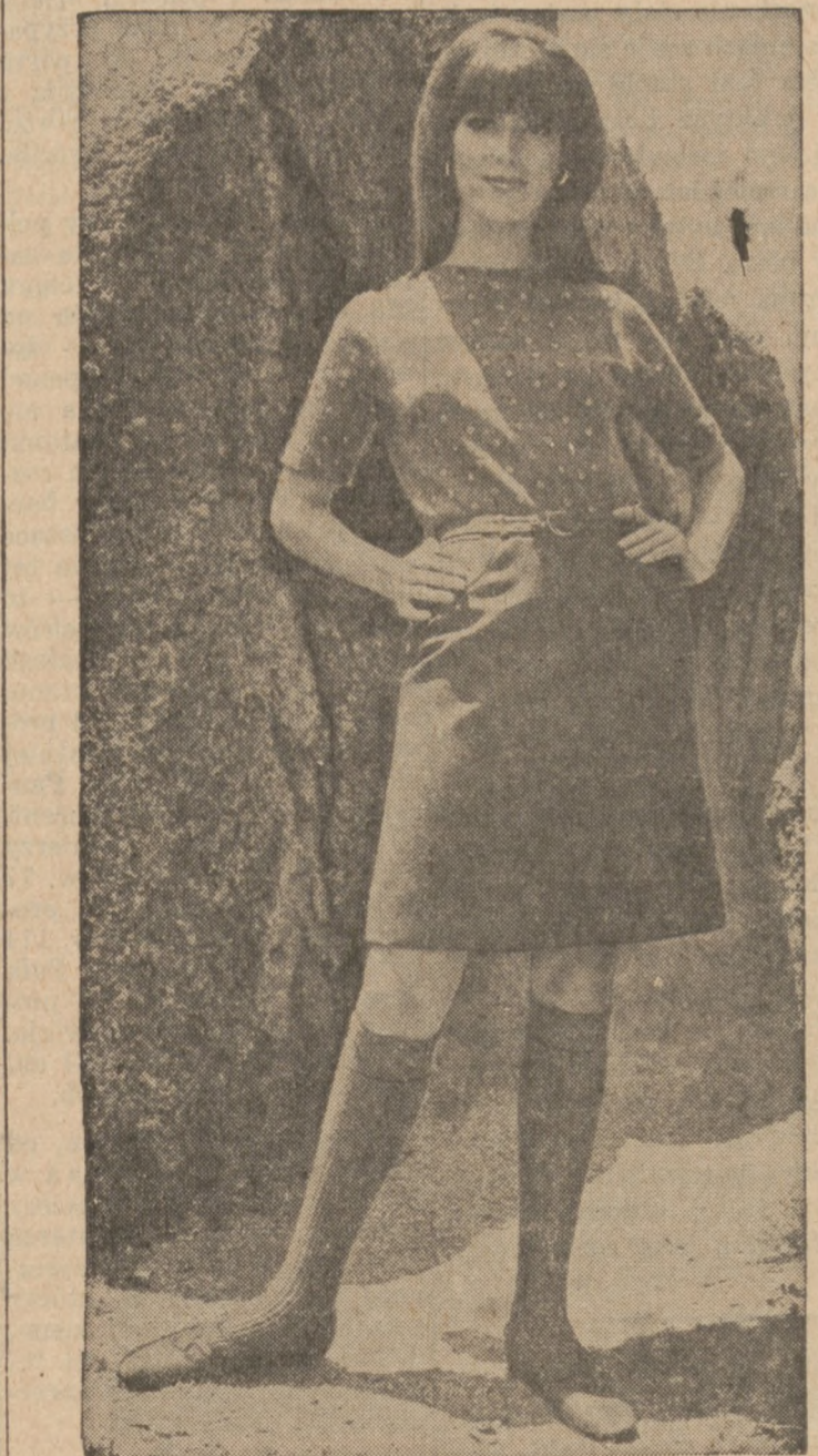
KRÓTKA spódniczka wełniana i ciepły sweterek w deseń, to niedozowna część garderoby młodej pani.

Po Informacje i Rezerwacje - - - - - Telef. BI 7-9873