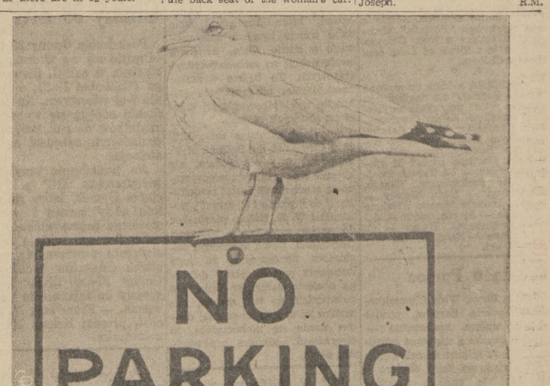
COLD FEET—This bird would rather defy the law than walk on the frozen harbor at Hyannis, Mass., where most waterways are ice-capped.

Admission to the film is $1; series tickets are $4 for all six films. An informal discussion follows all showings. For further information, write the Center for Film Study, 1307 S. Wabash, or phone 663-0080.