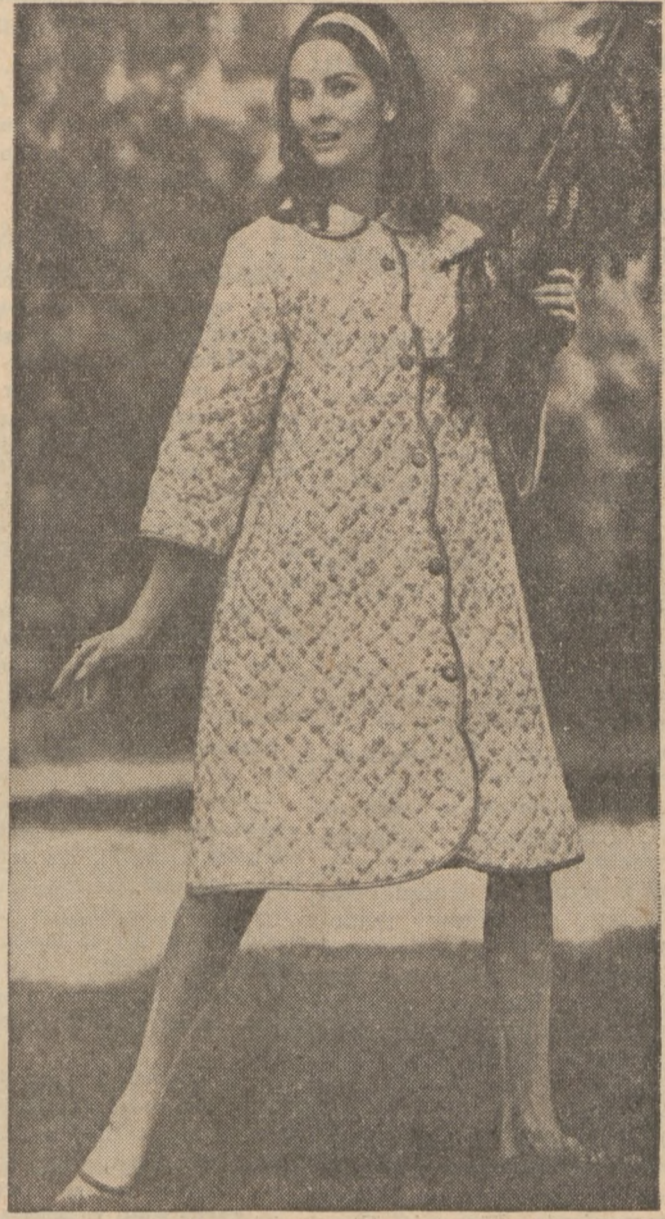
Wygodny watowany szlafroczek z niemnącej się flaneli.

11) Nie staraj się dziecko ochraniać przed wszystkimi niebezpieczeństwami w życiu, ani też nie staraj się chronić go od wszelkich zawodów. Przeciwności w życiu wzmacniają charakter, hartują ducha jak stal i czynią nas bar-