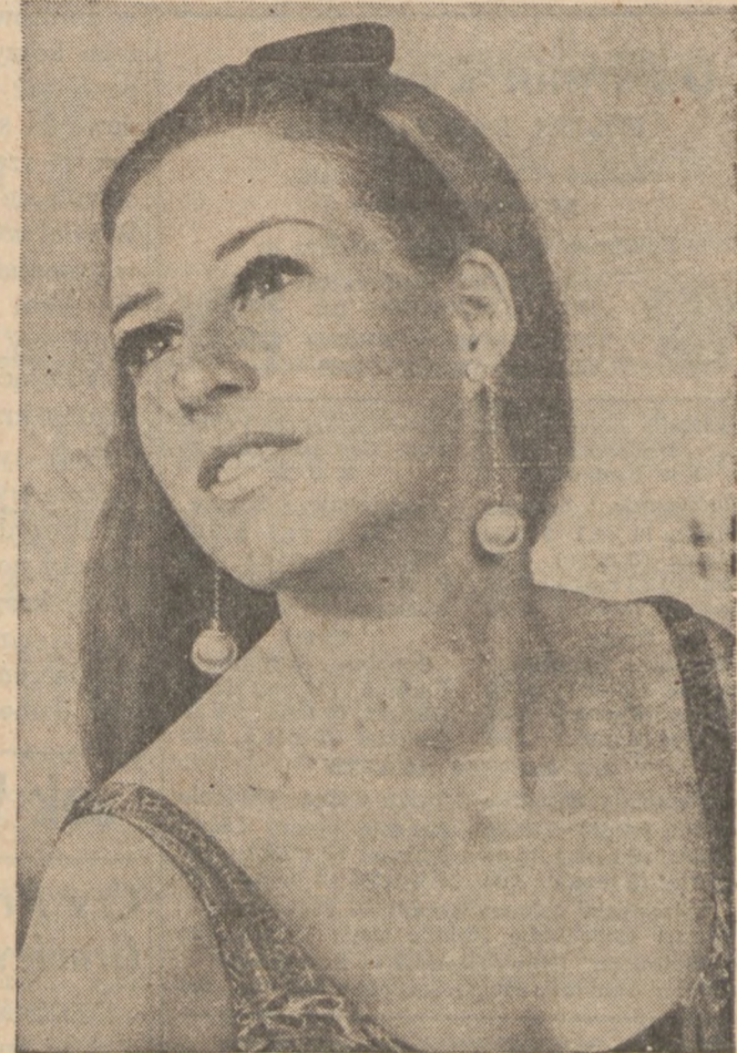
Kolczyki ze sztucznych pereł przemocowanych do długiego łańcuszka. Długie kolczyki sięgające niemal ramion, to ostatni krzyk mody z Paryża.