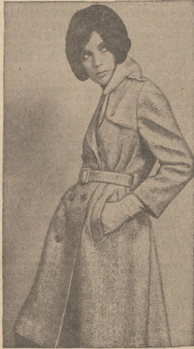
Płaszcz przeciwdeszczowy uszyty ze srebrnej tkaniny (mylar knit) nadaje się nawet na najbardziej eleganckie przyjęcia wieczorowe.

systemów politycznych, rozpadu imperiów, i powstania nowych. Na tle tych przeobrażeń wartość i idee społeczne przeszły też zasadnicze zmiany i wstrząsy a zmiany te przewartościowały i w niektórych wypadkach unicestwiły szereg zawałoby się trwałych osiągnięć społecznych. Nie ostała się też rodzina. Uderzeniem w jej istnienie stały się rozwody, których liczba rośnie z zaskakującą szybkością. Rozwód przy wszystkich swoich gwarancjach finansowych i prawnych jest właściwie unicestwieniem rodziny. Tak jakby dom poddano rozbiórce. Zagrożenie Rodziny Instytucja Rodziny jako taka nie podlega bezpośrednim atakom, ale istota jej jako instytucji jest narażona na dywersję ze strony kolidujących z nią "nowych tendencji" społecznych i światopoglądowych. Kult młodości, wczesna i przedwczesna emancypacja młodych, forsowana przez nich samych i popierana przez czynniki urzędowe, a często pod wpływem "skrajnych elementów" zbyt często odcina dzieci od rodziców. "Młodzieżowa Kultura" Młodzież skwapliwie korzysta z tej emancypacyjnej atmosfery, która zdążyła już wytworzyć "młodzieżową kulturę", a raczej "modę". Ta kultura przez swoją obcość, agresywność i niedojrzałość, która przejawia się chociażby w tańcach, muzyce, piosenkach i strojach, wyobcowuje młodzież od swoich rodziców. Samodzielność Przesadne akcentowanie samodzielności nie ma charakteru wychowawczego, ale jest dywersją w stosunku do rodziny. Ta samodzielność