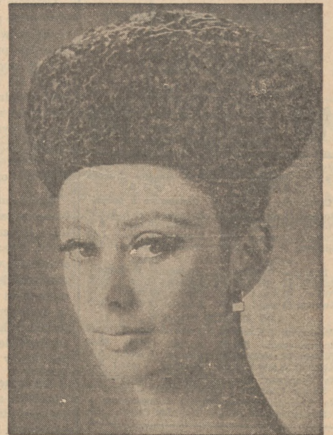
KAPELUSIK w stylu hiszpańskim z futra perskich baranków.

Pewne czasopismo paryskie rozpisало konkurs na najlepszy list miłosny, zaznaczając, że musi zawierać "wszystko istotne", nie przekraczając rozmiarów 1 strony. Ponieważ działo się to we Francji, w konkursie wzięło udział wielu artystów, dziennikarzy, uczonych i nawet polityków. Ale pierwszą nagrodę otrzymał młody kupiec. Jego list zawierał u dołu napisane słowo jedno zdanie: "Tak puste, jak arkusz, jest moje serce, gdy nie widzę Ciebie".