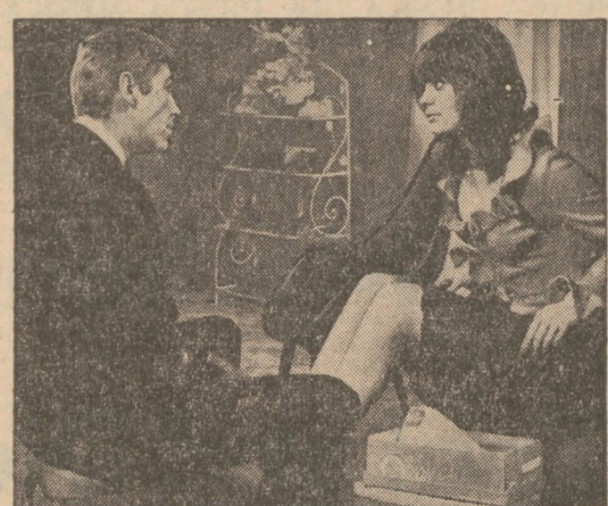
On, to Charlie Ellis, Eli Kotech, Henry Silverstein oraz Inspektor Day, pozatym jeszcze sprzedawca butów w filmie "Dead Head On A Merry-Go-Round", w którym właśnie poznaje piękną partnerkę Nine Wayne. Film ten jest grany teraz w kinie B&K CONGRESS, 2135 Milwaukee Ave. Naturalnie naprawde jest to James Coburn ("Our Man Flint"), który gra takiego spryciarza w tym barwnym filmie. Drugi film w Congress to "western" pod tytułem "Duel At Diablo", w którym występują James Garner i zdobywca Oscara, Sidney Poitier. (R.M.)