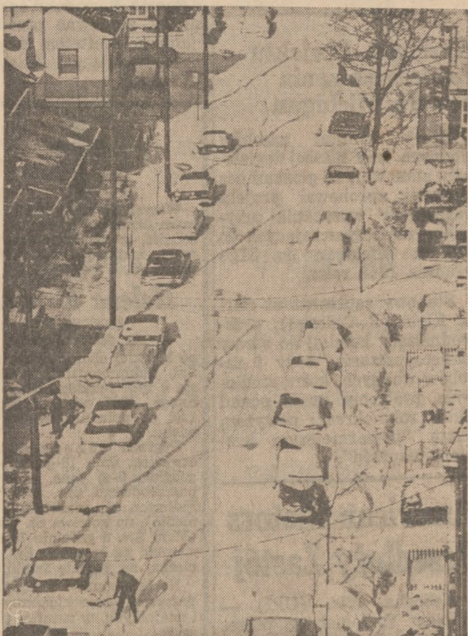
EXCEPT THE SIDE STREETS—Most of the main thoroughfares have been cleared of the 15 inches of snow that fell during New York's Great Blizzard of '67, but the side streets in residential areas are another story.