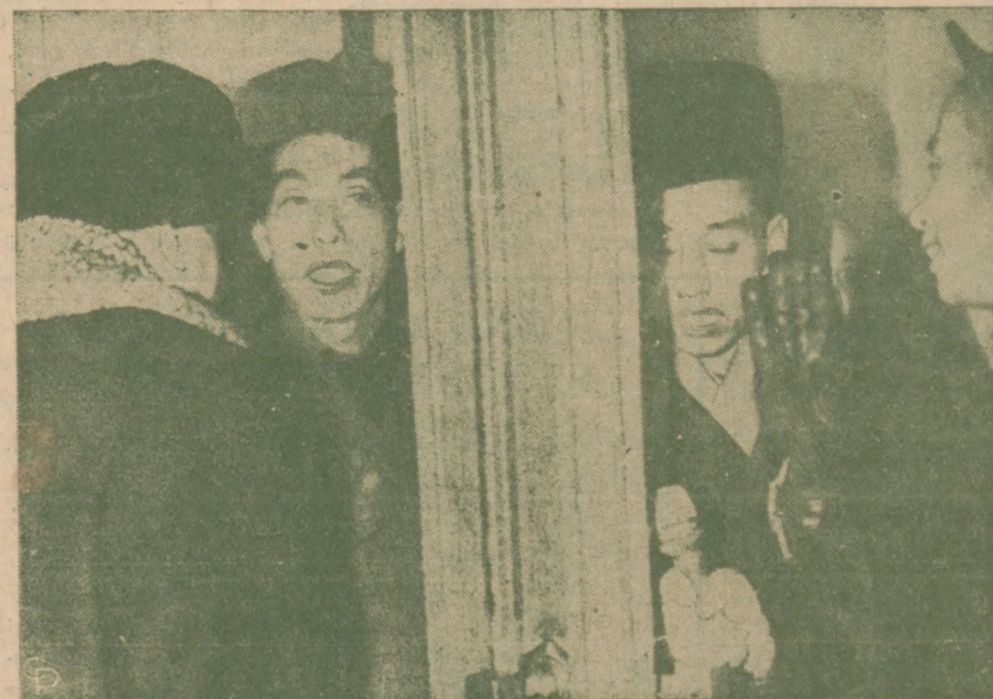
KOMUNISTYCZNI DYPLOMACI CHIŃSCY nie chcą rozmawiać z delegacją 400 manifestantów, zamykając jej drzwi przed nosem w ambasadzie Chin w Moskwie.