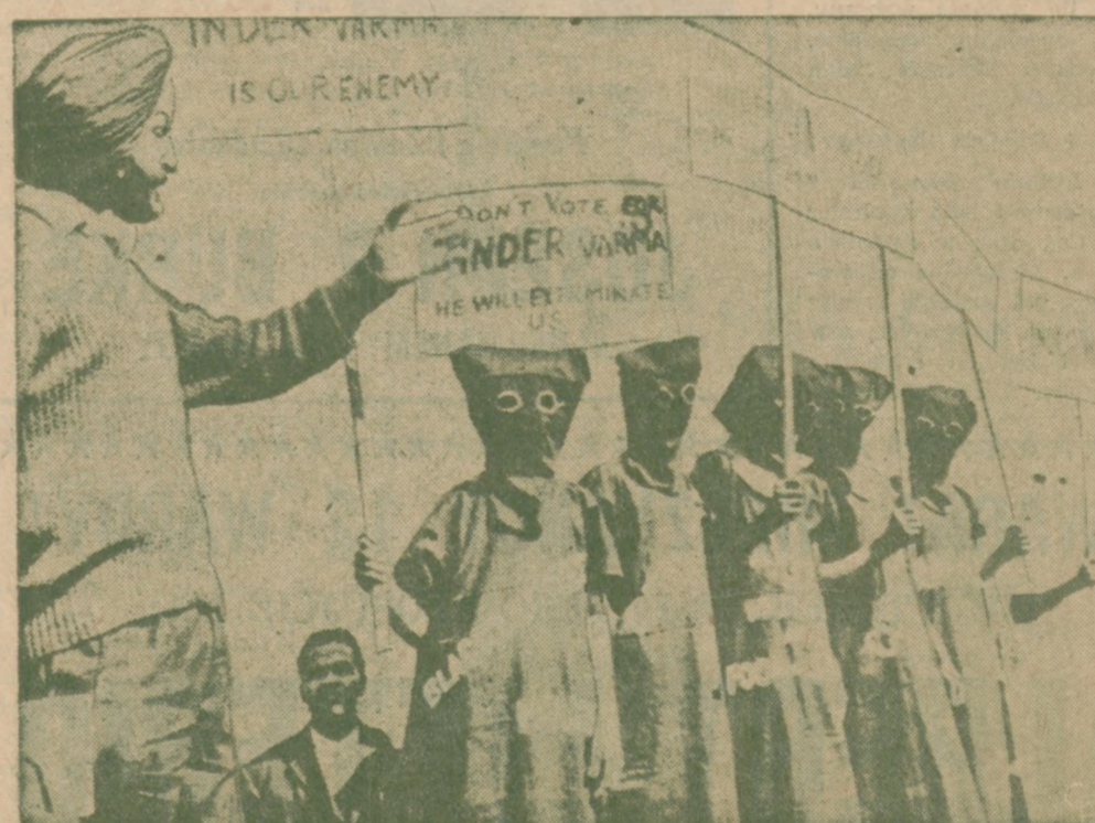
KAMPANIA WYBORcza W INDIACH. Zakapturzeni zwolennicy kandydata opozycji Inder Varma w New Delhi manifestują przeciwko rządzącej partii Kongresu, oskarżając ją o odpowiedzialność za niedzę mas.