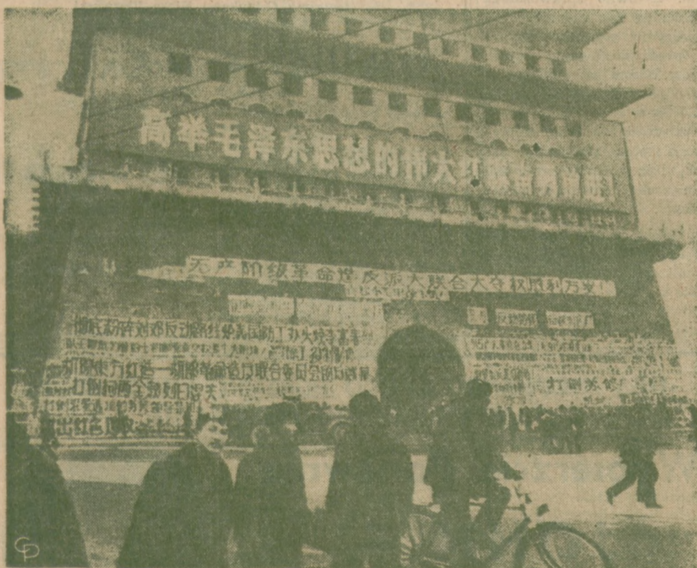
OSTATNIE WIADOMOŚCI SĄ NAKLEJANE W PEKINIE na bramie pałacu cesarskiego. Całe miasto oblepione jest takimi afiszami.