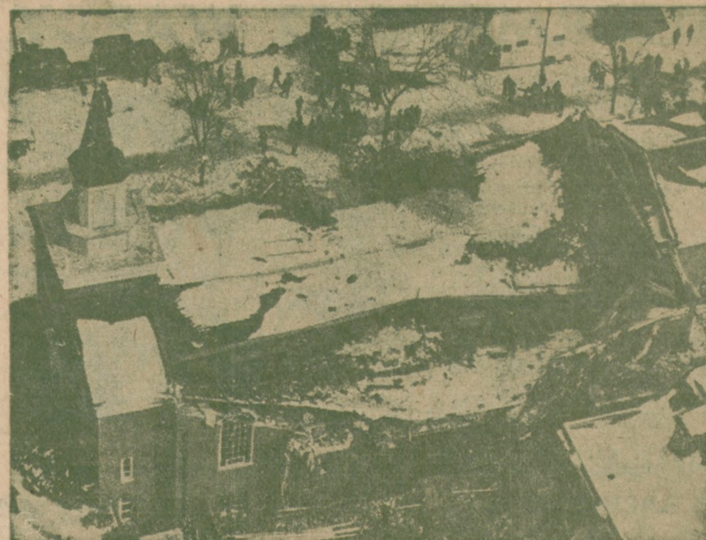
W KOŚCIELE ŚW. RÓŻY Z LIMY w Baltimore, Md., zawalił się dach pod ciężarem śniegu, w czasie nabożeństwa w Popielec. Nikt nie został zabity.