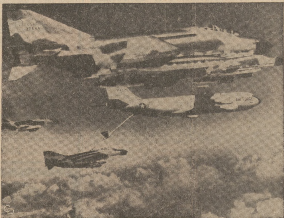
FILL 'ER UP—An F-4C Phantom jet is refilled in midair somewhere over Vietnam by a U.S. Air Force KC-135 Strato tanker.

The public is invited to attend this display about the art of drawing.