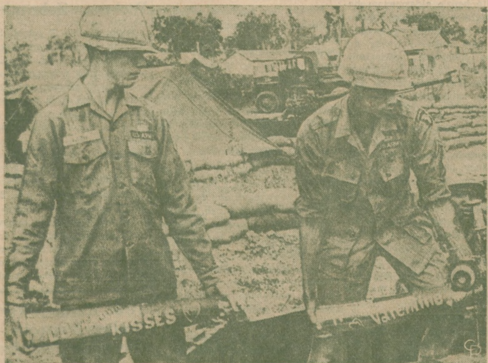
NA POCISKACH ARTYLERYJSKICH przygotowanych do wystrzelenia na Północny Wietnam w dniu Walentynek znajdują się napisy "Happy Valentine" oraz "Love and Kisses"