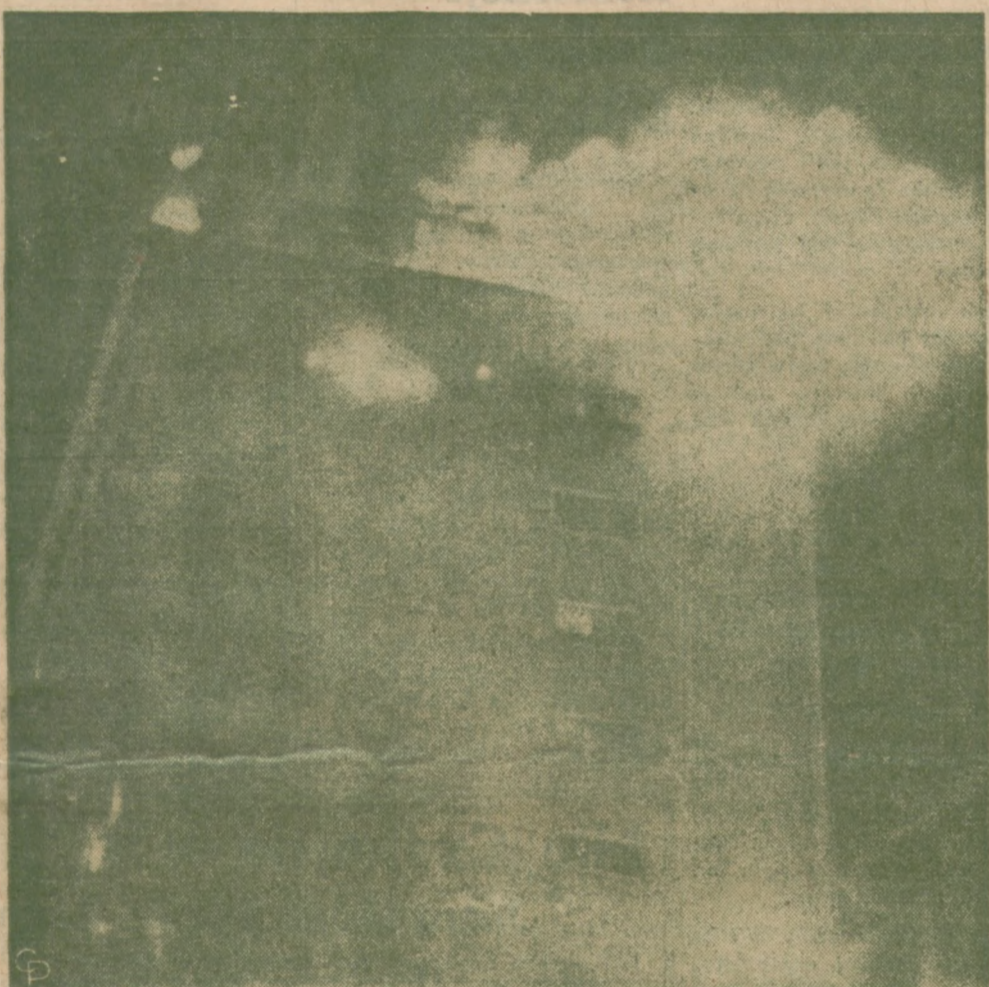
POŻAR RESTAURACJI na 10-em piętrze drapacza chmur w Montgomery, Alabama, zabił 27 osób.