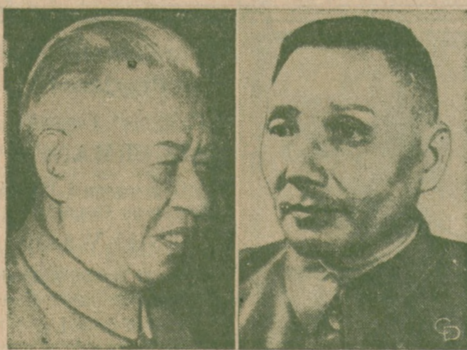
DWAJ PRZYWÓDCY KOMUNISTYCZNI, którzy nie uznają Mao Tse Tung za bóstwo a mianowicie prezydent Chin Liu Shao-Chi (po lewej) i sekretarz generalny partii Teng Hisao-Ping (po prawej) zostali podobno usunięci przez zwolenników Mao w chaosie konfliktów walki o władzę.