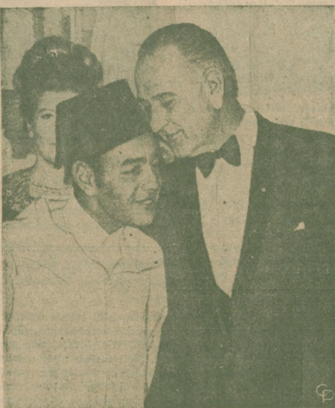
KRÓL MAROKKA HASSAN II złożył wizytę prez. Johnsonowi w Białym Domu.