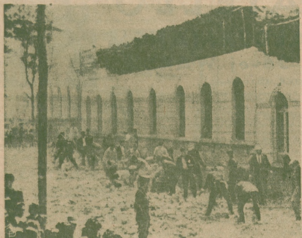
DOM ZBURZONY W IQUITOS, PERU w trzęsieniu ziemi, które objęło dwa kraje, Kolumbię i Peru.