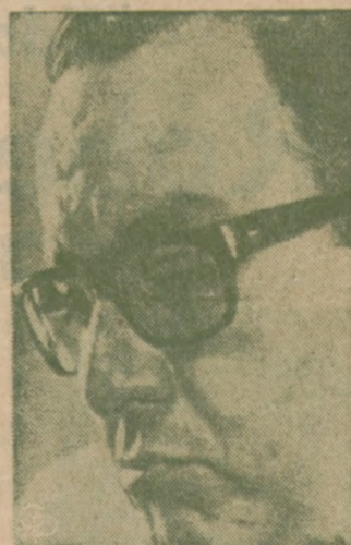
GEN. ANASTAZIO SOMOZA, potomek rodziny od wielu lat rządzącej małą republiką Nicaragui, został wybrany prezydentem tego kraju.