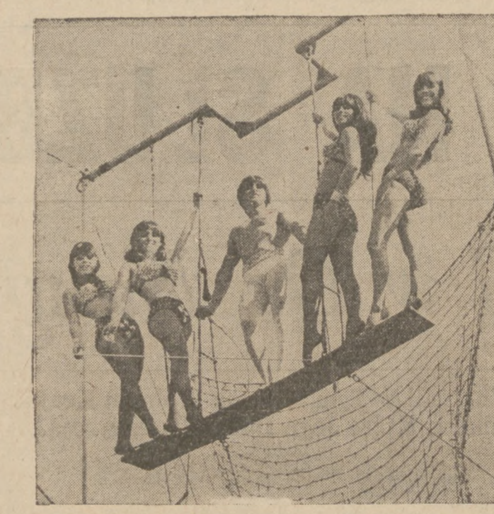
THE FLYING CAVARETTAS — SWINGIN' TEENS

1967 marks the Silver Anniversary of the famous Medinah Shrine Circus, produced by Polack Brothers and the 25th Annual Edition comes to Chicago on Thursday, March 2nd, to continue through Sunday, March 19th at Medinah Temple, Wabash and Ohio Streets.