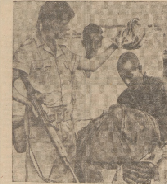
GRENADE CHECK—A British soldier looks for a grenade under the hat of a civilian after five other British soldiers were injured by a terrorist hand grenade in Aden, a British protectorate. Rooftop snipers also fired on soldiers and police during violence by "liberation" groups demanding British withdrawal from Aden on the Arabian peninsula.

There tends to be cooperation among them with the MO. The Civil Personnel office will often help servicemen write a letter of complaint to the ombudsman on a matter which comes within a wider sphere than its own.