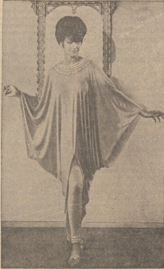
Hinduski styl sukni dla gospodyni na przyjęcia wieczorowe w domu. Suknia uszyta jest z seledynowej "jersey", a nosi romantyczną nazwę "Languid Lotus."

Interesujący jest fakt, że dziecko w towarzystwie swoich rówieśników, chętnie spożywa potrawę. Pozwól więc jeść małcowi przy stole razem z dorosłymi, nie zwracając na niego szczególnej uwagi.