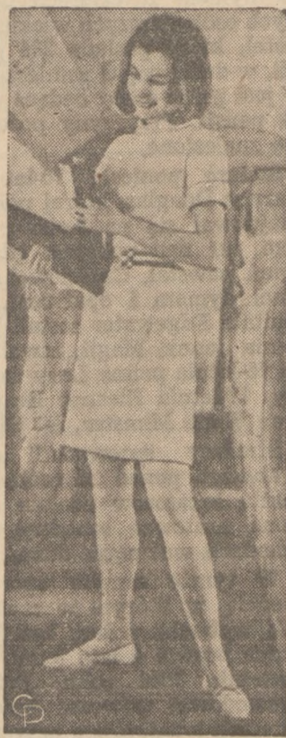
NEW FLIGHT PLAN—Passengers on American Air Lines planes between New York and Los Angeles are going to be asked how they like this—mini-skirts with fishnet hose and white shoes for flight stewardesses.