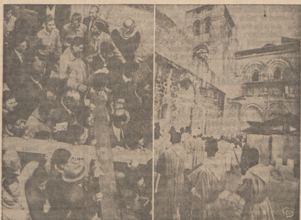
GOOD FRIDAY IN JERUSALEM—Crowds of devout pilgrims carry the heavy wooden cross (left) along Old Jerusalem's cobblestone streets on Good Friday, stopping at each Station of the Cross for prayer and meditation. The last five Stations of the Cross are in the Church of the Holy Sepulchre. At the right, choir boys enter the church, site of Calvary and the tomb of Christ. The ancient church now is getting a $2 million restoration.