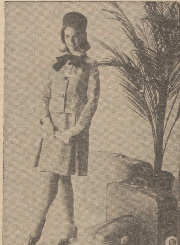
PRALNY kostium letni z bawełny w białe i czarne wążki paski.