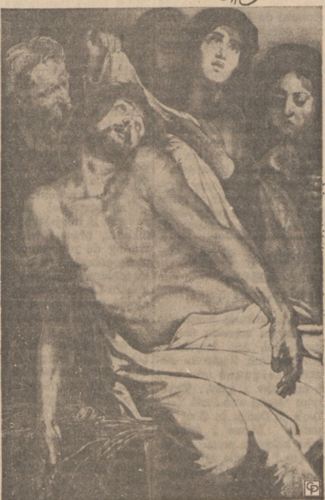
"And after this Joseph of Arimathea, being a disciple of Jesus, but secretly for fear of the Jews, besought Pilate that he might take away the body of Jesus: and Pilate gave him leave. He came therefore, and took the body of Jesus. And there came also Nicodemus, which at first came to Jesus by night, and brought a mixture of myrrh and aloes, about an hundred pound weight. Then took they the body of Jesus and wound it in linen clothes with the spices, as the manner of the Jews is to bury."—John 19:38-40.

PETER PAUL RUBENS was born at Siegen, Westphalia, in 1577. Taken to Antwerp, the boy studied with various masters and in 1598 was admitted to the artist's guild as a master, then went to Italy, returning eight years later. More than any other Flemish painter Rubens shows the influence of Italy, yet he never lost his Flemish real-life touch.