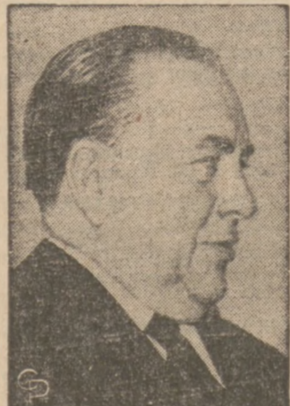
MAYOR RICHARD J. DALEY

Wybory miejskie, jakie odbędą się w najbliższy wtorek są wyobraźnią politycznymi, to znaczy kandydaci na urząd mayora, klerka i skarbnika miasta ubiegają się o te urzędy z ramienia jednej lub drugiej partii.