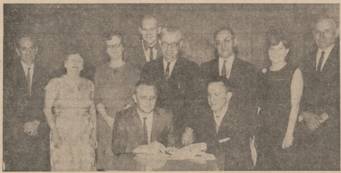
1967 NATIONAL PNA BOWLING TOURNAMENT COMMITTEE.—Members of the 1967 National PNA Bowling Tournament Committee...