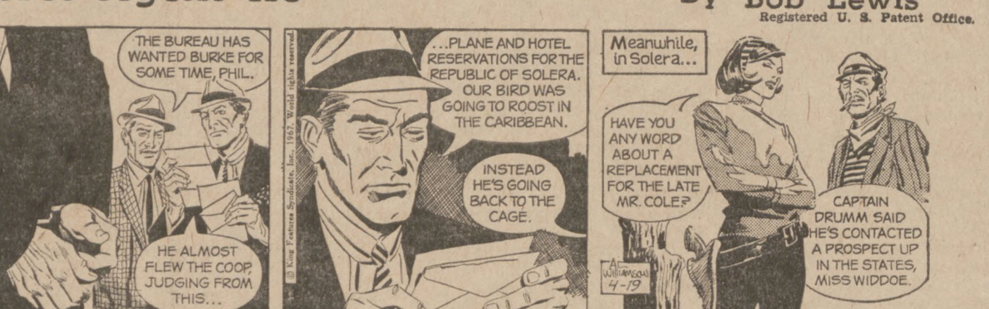
Meanwhile, in Solera... HE ALMOST FLEW THE COOP JUDGING FROM THIS...