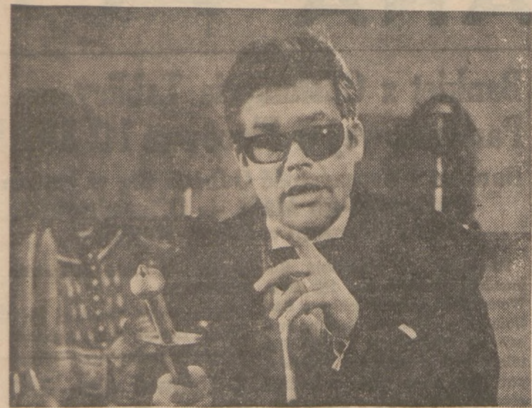
Cybulski jako reżyser tłumaczy młodemu aktorowi jak powinien zagrać mistrza i nim zostać!