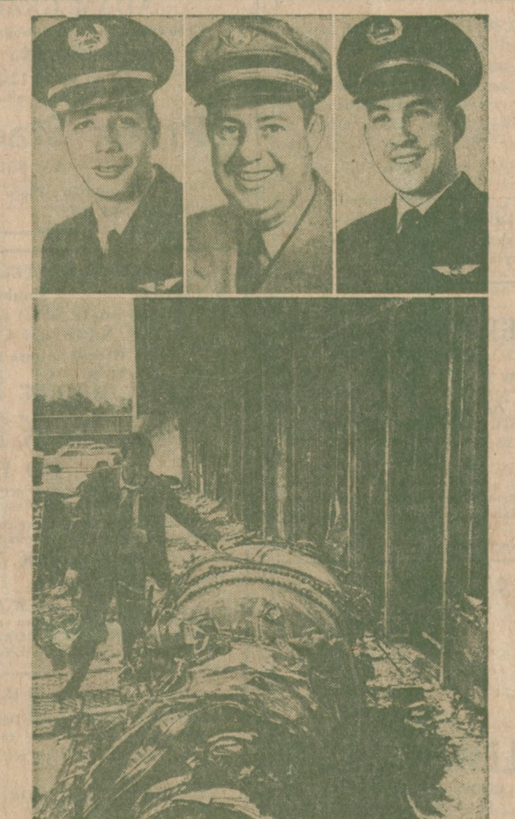
W NOWYM ORLEANIE PROWADZONE jest śledztwo w sprawie katastrofy, w której przy lądowaniu rozbił się jet Delta DC8, przy czym zginęło 19 osób, w tym trzech członkowie załogi (na zdjęciu u góry).