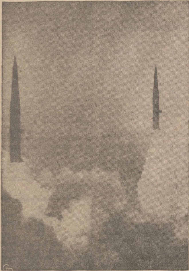
TWIN LAUNCH —Only 100 yards apart, two U.S. Army Pershing missiles roar skyward during the first simultaneous launch from the Black Mesa firing point near Blanding, Utah. Capable of using nuclear warheads, the missiles hit their targets nearly 400 miles away.